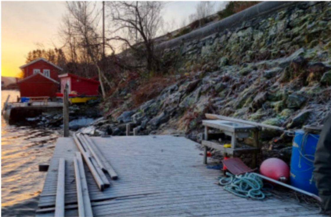
Foto av dagens situasjon, lagt ved klagen