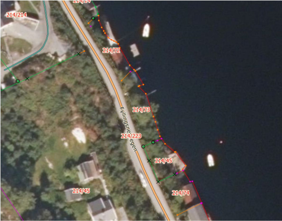
Flyfoto frå dagens situasjon