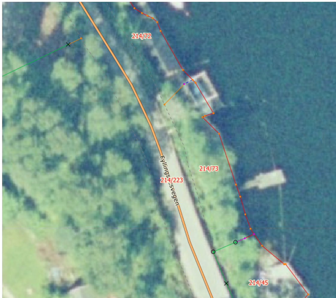
Flyfoto frå 2003

Gitt at tiltaket er lovleg etablert vil eksisterande bruk vere tillate, men endring til betongbryggje og etablering av naust vil i alle fall innebære eit større og meir privatiserande inngrep i området enn det som er tilfellet i dag. Omkringliggjande naust har i hovudsak eksistert der sida 1960-tallet og kan ikkje gjeve forventning om at det skal tillatast med naust i eit LNF-område i dag.