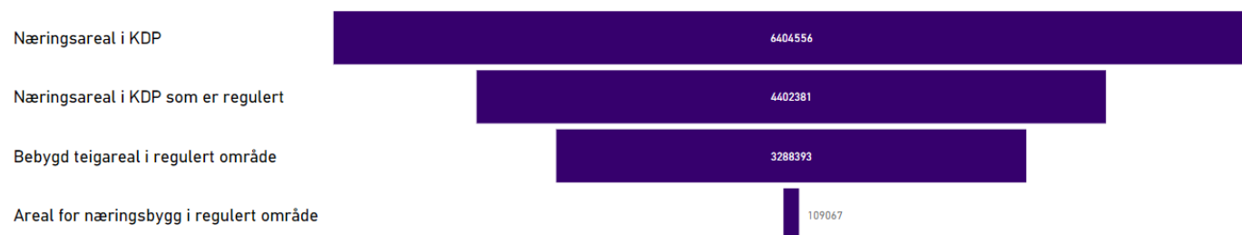
Figur 3 Næringsareal i KDP Lindåsneset med Mongstad

I Kommunedelplanen for Lindåsneset med Mongstad er det 6 404 dekar næringsareal. Av dette er nesten 70 prosent (4 402 dekar) regulert. Dei bebygde teigane utgjør 74 prosent av dei regulerte areala.