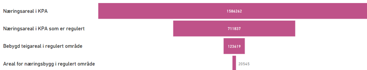
Figur 1 Næringsareal i gjeldande KPA

I Kommunedelplanen for Knarvik-Alversund med Alverstraumen er det sett av 142 dekar næringsareal. Av dette er nesten 90 prosent (126 312 kvadratmeter) regulert. Dei utbygde teigane utgjør 36 prosent av dei regulerte areala. Det er med andre ord store område som er regulert, men endå ikkje utbygd også i dette planområdet. Det størstenæringsområdet innanfor dette planområdet er Galteråsen der mykje av det regulerte arealet er til sals.