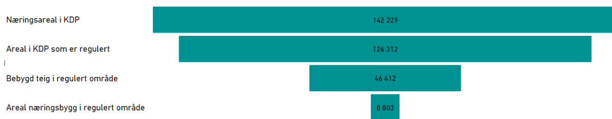
Figur 2 Næringsareal i KDP Knarvik-Alversund med Alverstraumen

Dette planområdet er det mest aktuelle for plassering av dei arealkrevjande verksemdene som i dag ligg i Knarvik.