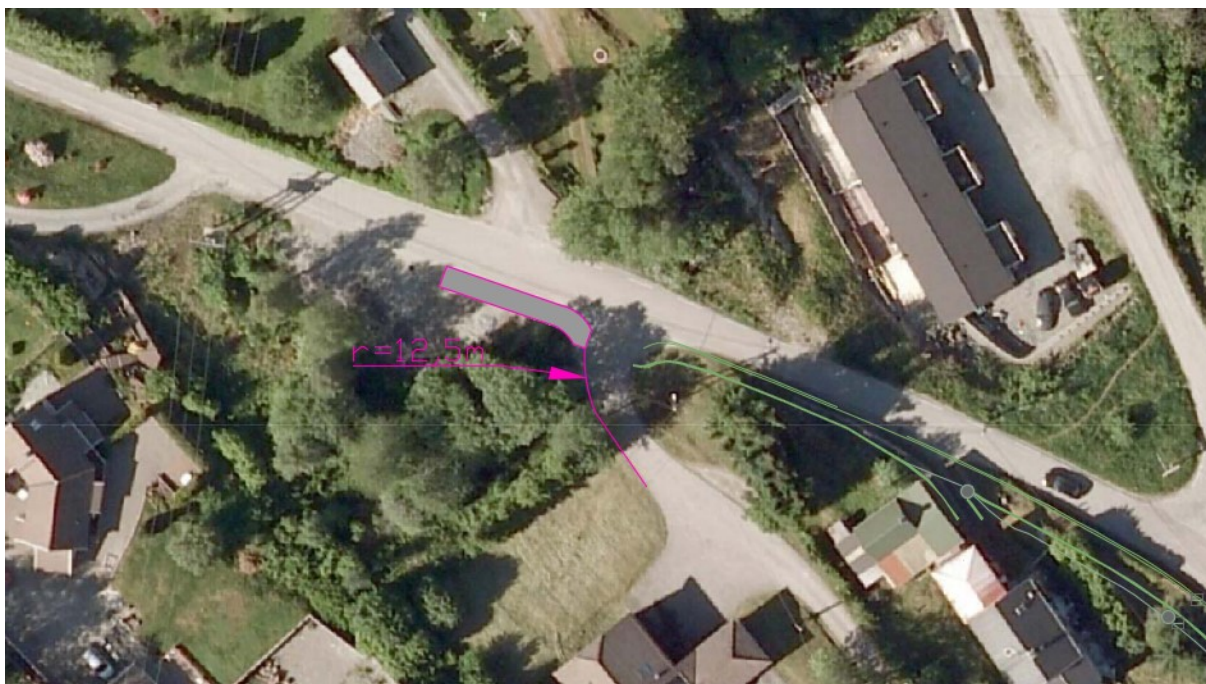
Skisse til utbetra avkøyrslle tilpassa fylkesvegen slik den ligg i dag. Grøne liner er innmålt nytt fortau. Rosa liner er framlegg til nytt fortau og svingradius innover i avkøyrsla.

Nedanfor er ei skisse til korleis avkøyrsla kan avgrensast i vest, der det i dag er eit utflytande areal med køyrevog, vegskulder og lagerområde. Skissa tek utgangspunkt i at avkøyrsla vert avgrensa med eit fortau som vert ført forbi avkøyrsla som ligg på motsett side av vegen. Skissa er utarbeida med utgangspunkt i lastebil som dimensjonerande køyretøy.