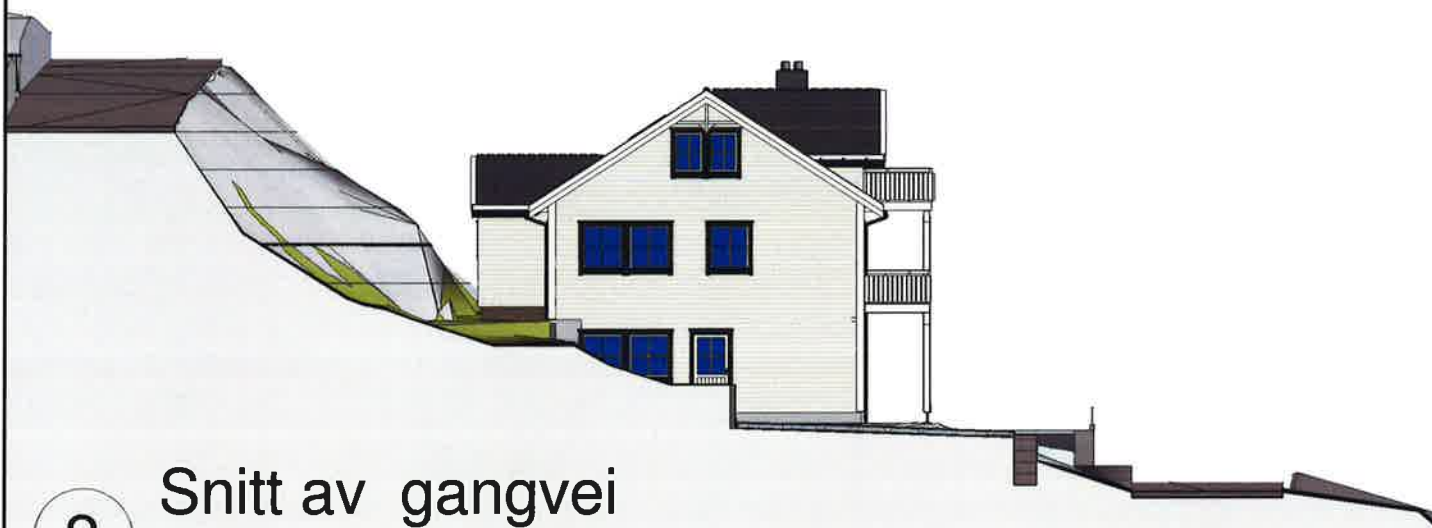
2 Snitt av gangvei 1 : 200