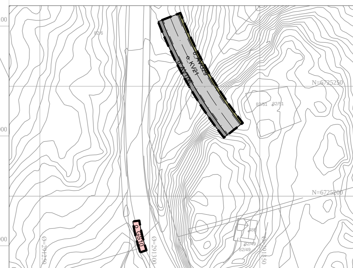
Vertikalnivå 3 - over grunnen (bru) / målestokk 1:1000