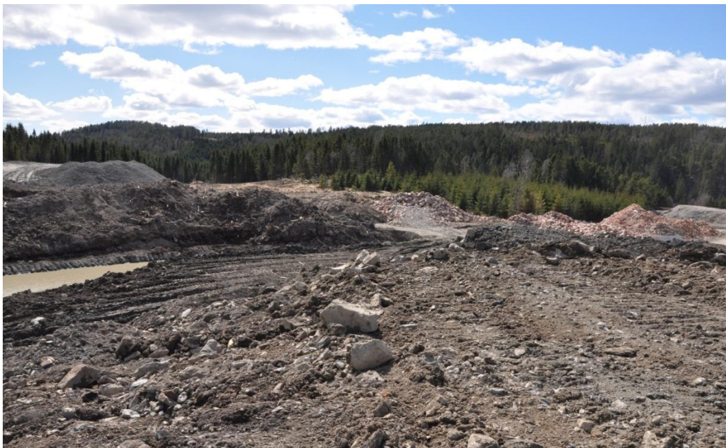
Bilde 1 Frå eit av Lindums deponi for ordinært avfall på austlandet

Blanda avfall frå hushald og næring er ikkje aktuelt å deponere. Heller ikkje anna avfall som kan brytast ned biologisk. Det gjer at deponiet ikkje vil gi luktproblem i omgivnadane.