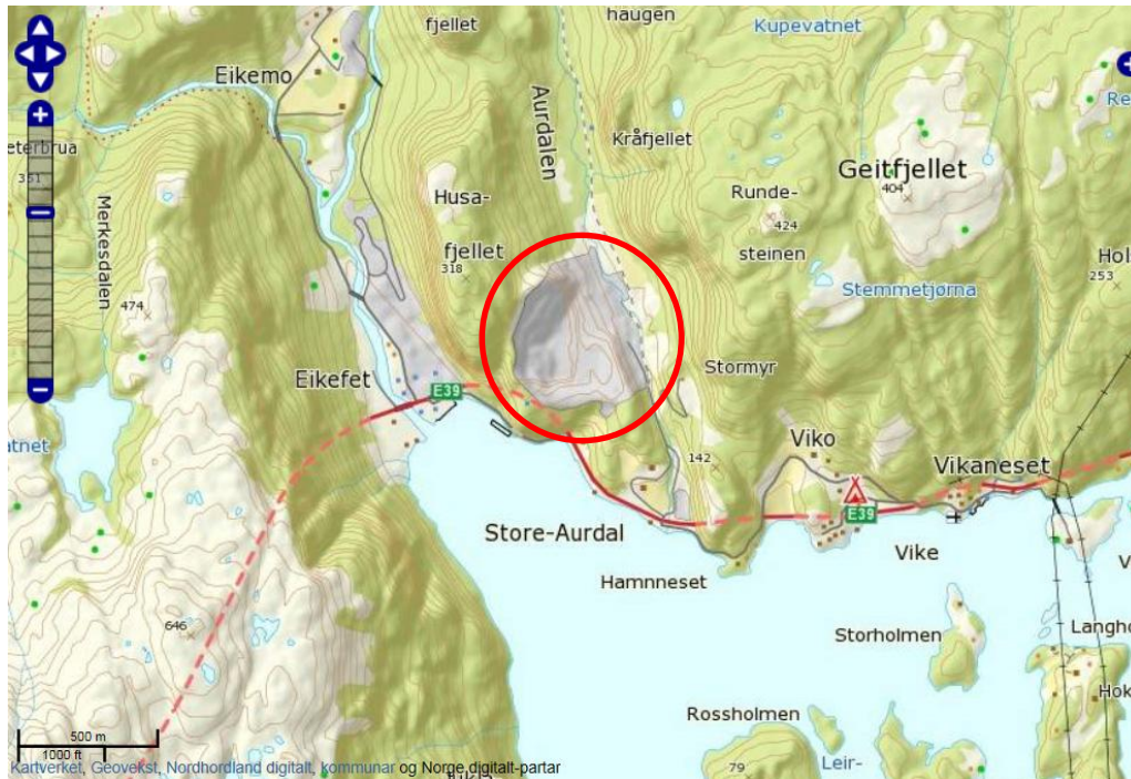
Bilde 2 Planområdet visast med raud ring.

Endringa i planområdet omfattar deler av eigedommane gnr/bnr 220/13 og 220/1 i Lindås kommune. Området har et areal på rundt rekna 2650 km 2 , og omfattar det gamle steinbrotet ved Eikefet. Tilkomsten frå E39 vil bli den same som til steinbrotet.