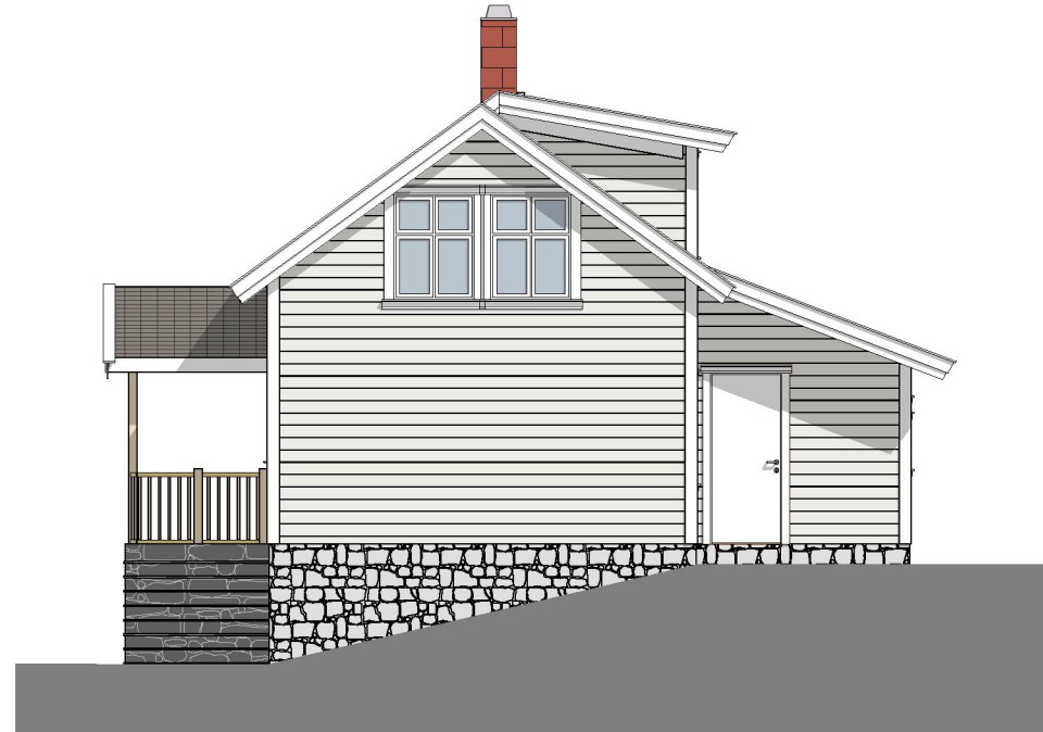
1:100 Fasade Øst