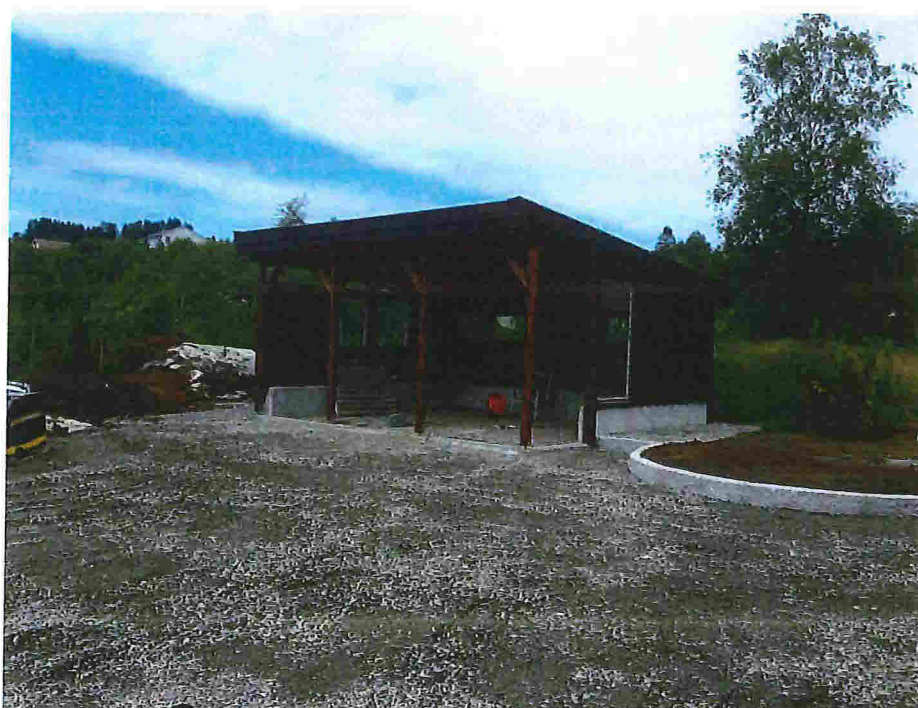
Bilete 2 – mot nord/vest