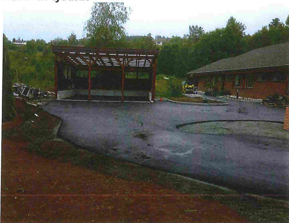
Bilete 1 – mot nord