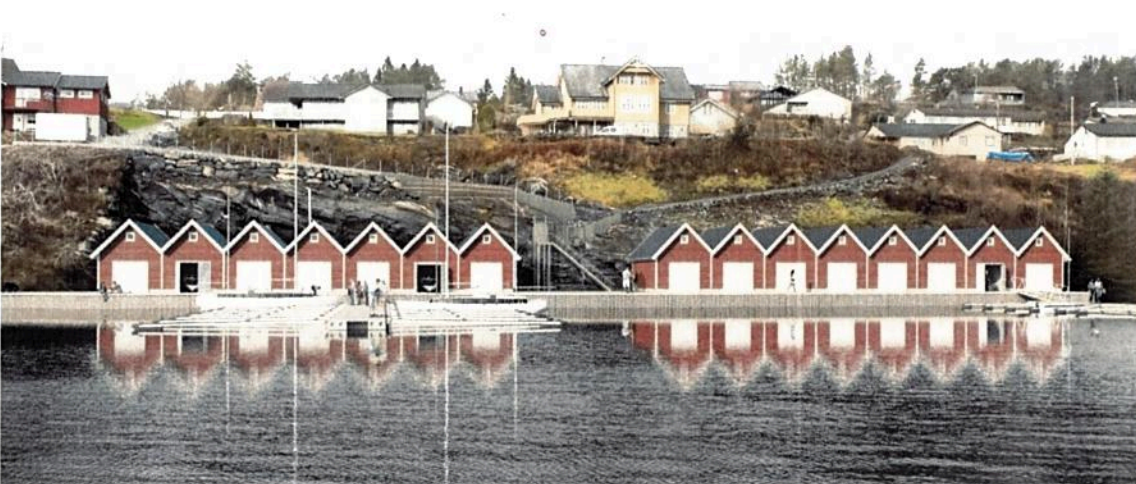
Figur 5 Slik det er planlagt når det står ferdig.