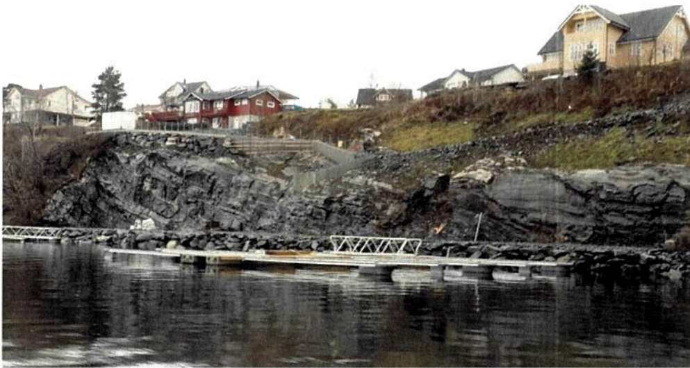
Figur 3 Slik ser det ut idag