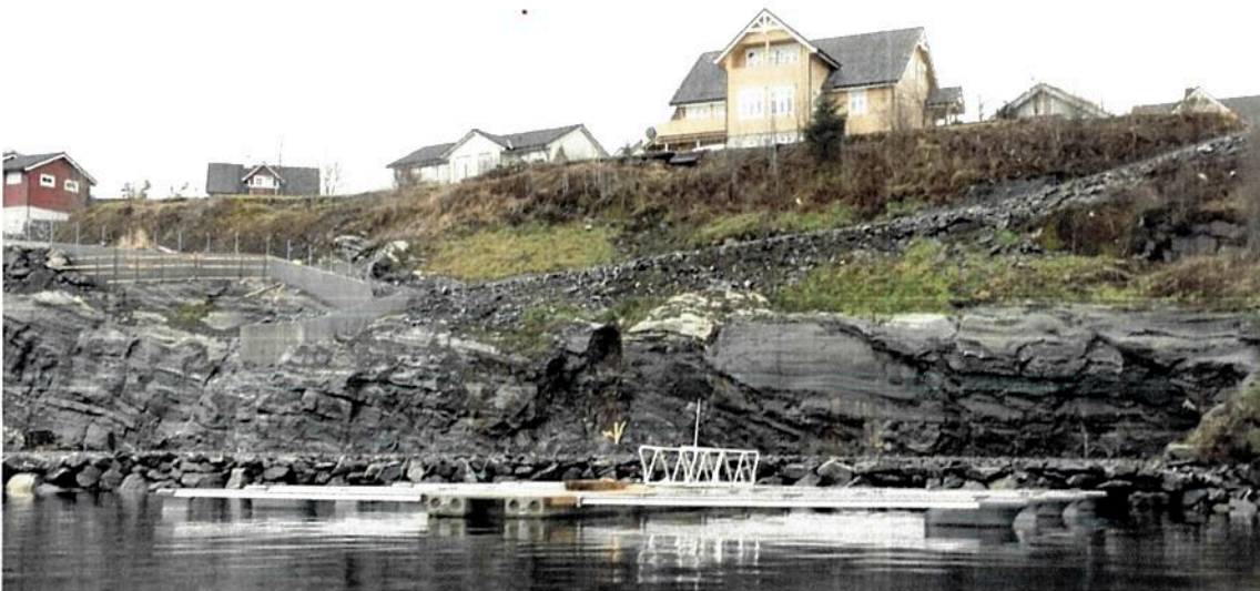
Figur 4 - Terreng i dag