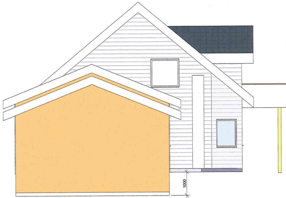
Fasade Nord 1 : 50