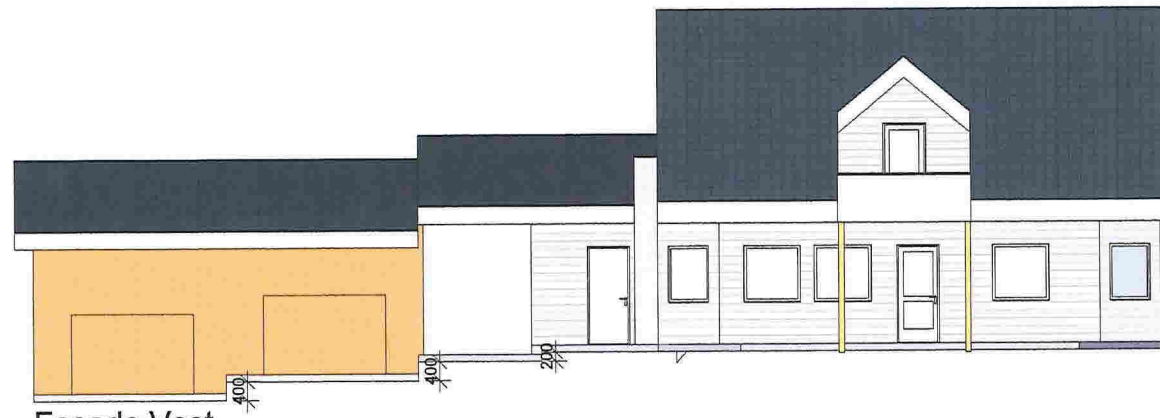
Fasade Vest 1 : 100