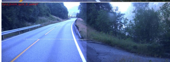
Vegbilette frå 2014