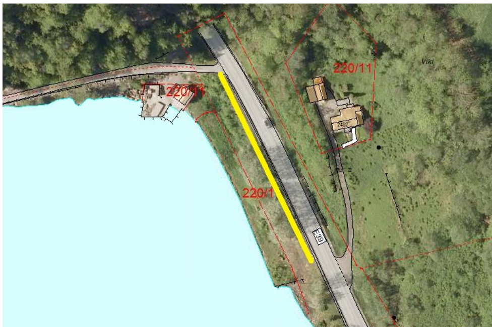
Kartutsnitt som viser omtrentleg plassering av ny gangveg føreslått av Lars Kåre Urdal.

Lars Kåre Urdal tok på synfaringa opp spørsmål om mogleg ny tilkomst for mjuke trafikantar via ein ny gangveg på vestsida av E39, plassert om lag langs den gule lina i kartutsnittet nedanfor.