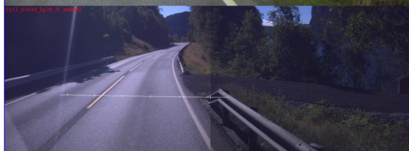
Vegbilette frå 2015