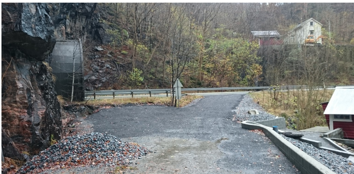
Avkøyrsla og tunellmunningen sett frå gang- og sykkelvegen.

Minstekravet til friskt frå avkøyrslar til E39 langs vegen her er 4 x 115 meter (jamfør N100 Veg- og gateutforming kap. E.1.4.2 og V121 Geometrisk utforming av veg- og gatekryss tabell 3.8). Det vil seie at friskt 1,1 meter over bakken 4 meter inn i avkøyrsla skal vere minimum 115 meter til begge sider av køyrebanane. Det er også krav om tilsvarande sikt lengde for trafikken som kjem på hovudvegen og skal inn i avkøyrsla (sikt bakover og framover langs hovudvegen).