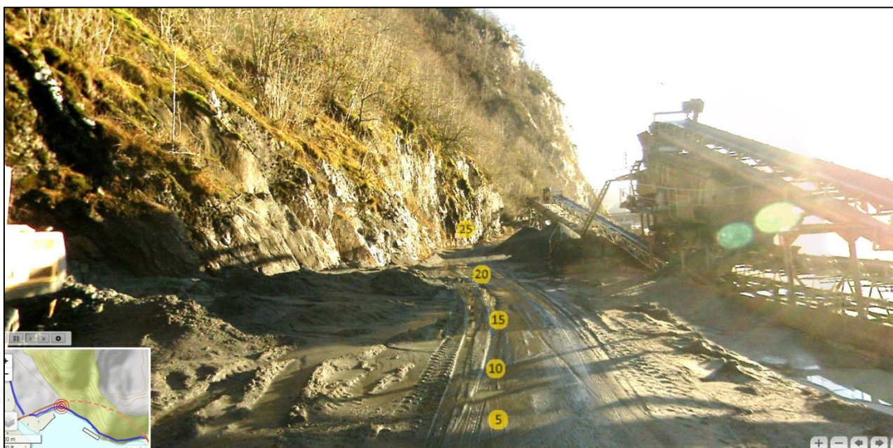
Figur 1 Gang- og sykkelvegen sett mot sør-aust

Slik gang og sykkelvegen ligg i dag (sjå bilete under) er det vanskeleg å halde ein fornuftig vedlikehaldsstandard på denne vegen. Delar av vegstrekninga fungerer mest som eit anleggsområde og lagerplass for både Mesta Eiendom AS og Oster pukk og sand AS, med eit vegdekke som ikkje eignar seg for sykkeltrafikk. Standarden på vegdekket umuliggjer også ei fornuftig vinterdrift.