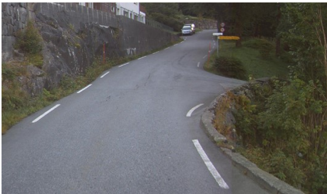
Vegbilde av kryss mellom fv. 404 Skarsvegen og kommunal veg Kvamsvågen

I søknaden skriver søker at han som skal bo i den nye boligen allerede bor i området, og at det derfor ikke vil bli økt/utvidet bruk av tilkomstvegen som følge av boligbyggingen. Etter vårt syn gir imidlertid en ny bolig et potensiale for økt bosetning, som vi anser uheldig i denne saken.