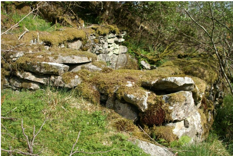
Figur 1 Gardflor- restar av grunnmur.