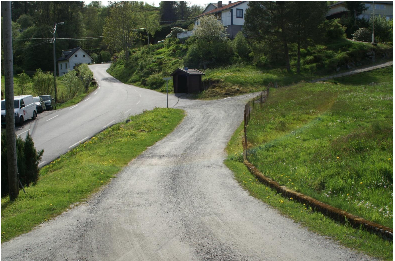
Fylkesvegen ved framtidig avkjørsel til veg f_V1.

Det er ikkje næringsverksemd i reguleringsområdet. Eit lite næringsareal grensar til området i sør-aust. (Ikkje aktivt i dag)