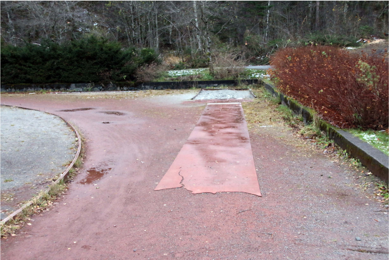
Lengdegropa som er mest i bruk.