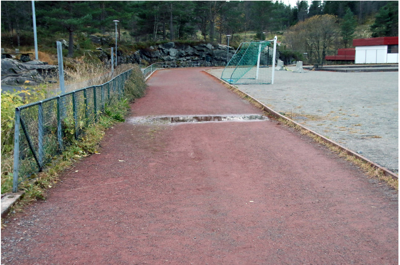
Langsida ned mot ungdomsskulen. Nedsigen om lag midt på. Drenering dårleg.