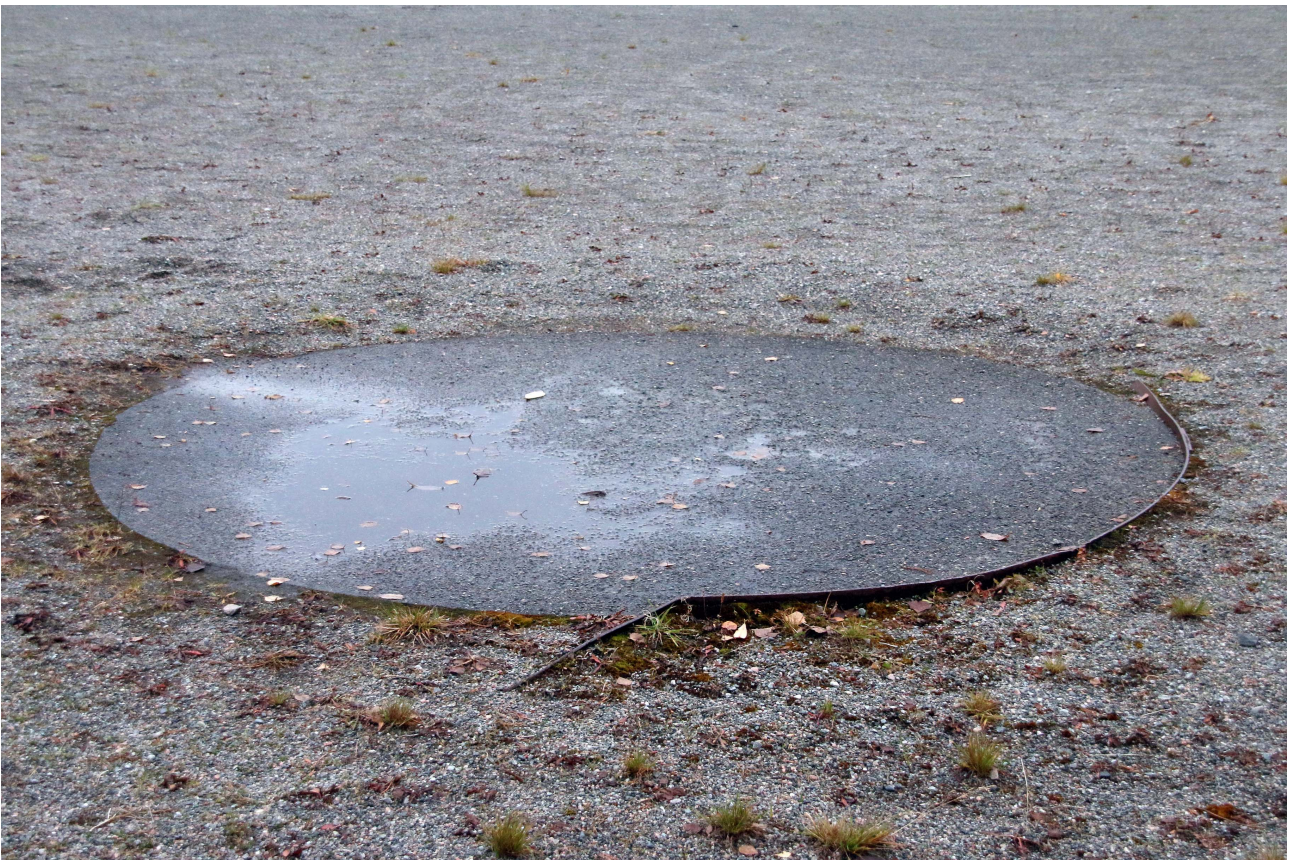
Nedsliten diskosring, der stoppkanten rundt vart brøyt vekk for ein del år sidan.