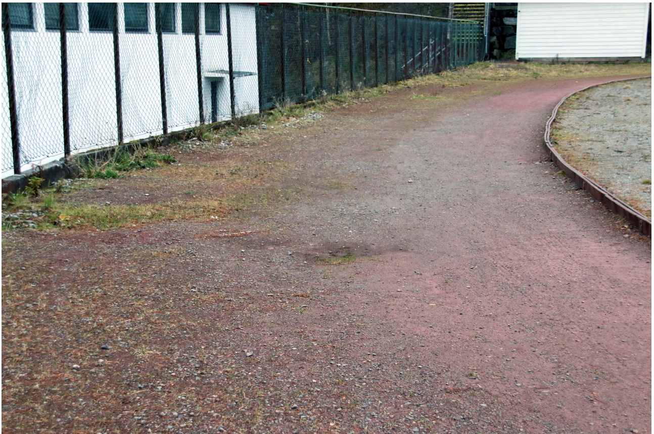
I vestre sving mot idrettsbygget manglar det mykje raudstubb.