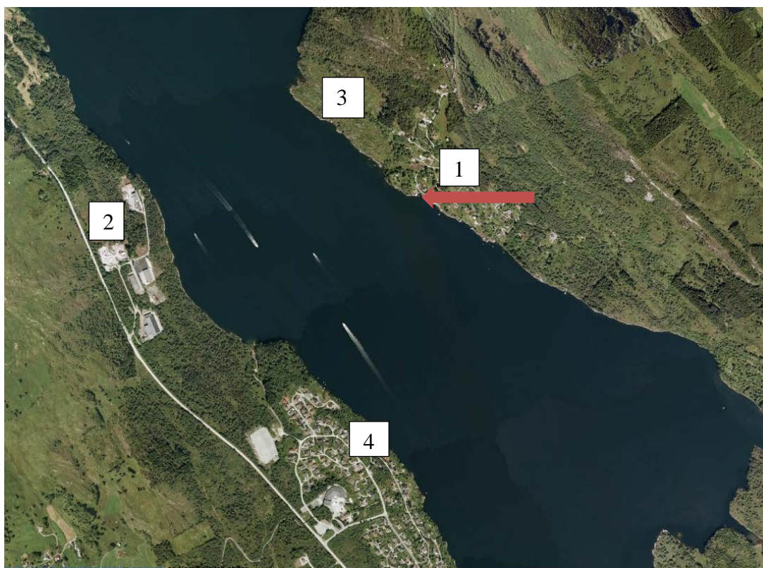
Figur 2: Utsnitt som viser eksisterende og planlagt bebyggelse i nærområdet

f) særlig verdifulle landskap, store sammenhengende naturområder med urørt preg eller vernede vassdrag