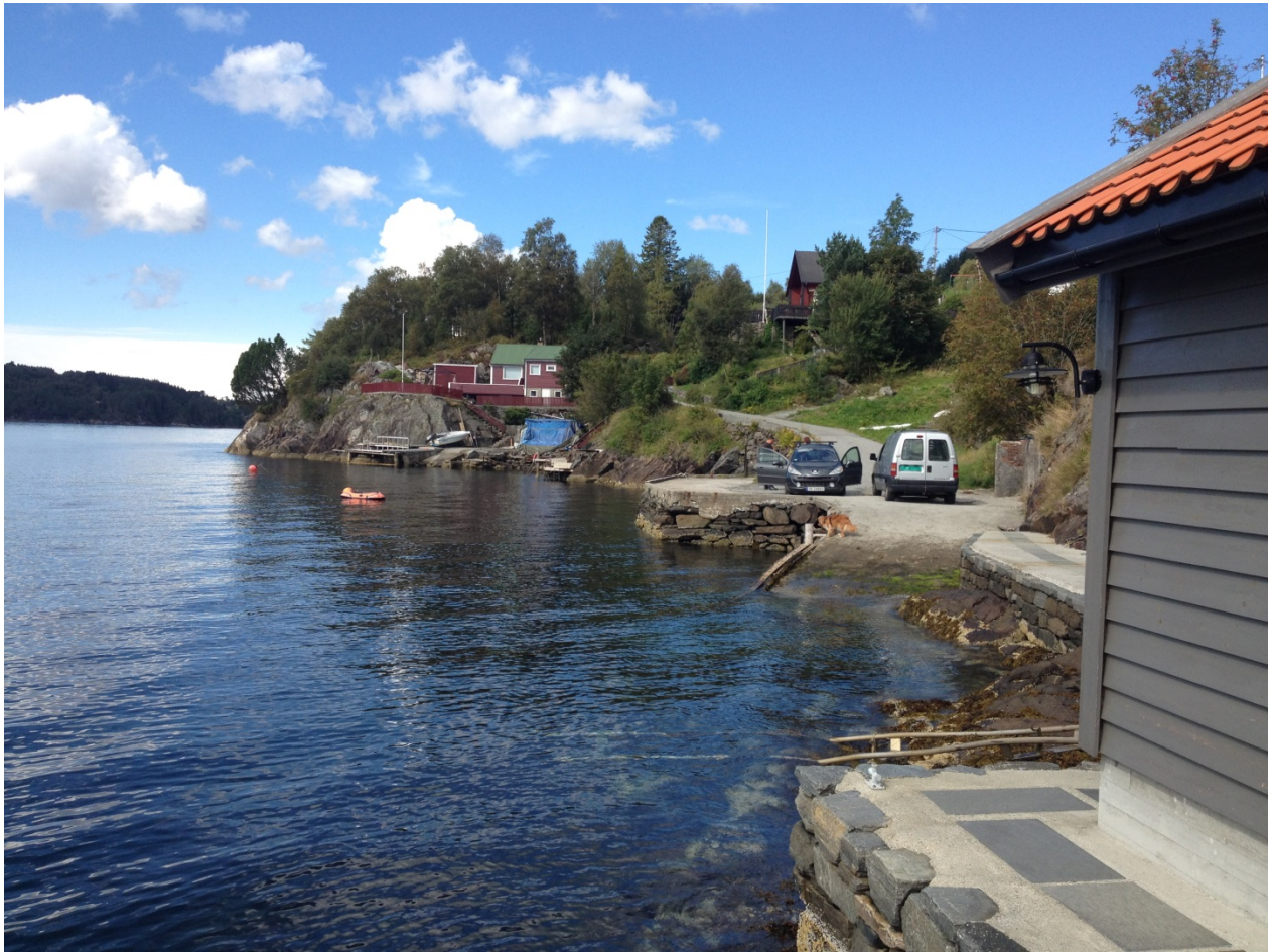
Figur 4: Nappevika, eksisterende slipp og kai midt i bildet

Som tidligere nevnt så vil tiltaket ikke skape varige inngrep av betydning, siden småbåtanlegget er reversibelt og parkeringsplassen er liten tett på veg og bebyggelse. Avstanden til området avsatt til tråling i kommuneplanens arealdel er så stor at vi ikke ser konfliktpunkter i forbindelse med den aktiviteten (se mørkeblått område i figur 1).