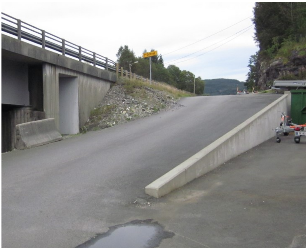
Foto: Undergang til E39.

I tilknytning til bruanlegget er det anlagt ein undergang som er del av veganlegget til E39. Det ser ut til at tilkomstvegen til området er flytta heilt inntil undergangen, og at kurvaturen inn og ut frå undergangen er endra. Dette er svært uheldig og medfører mellom anna at korkje mjuke trafikkantar eller køyretøy har tilstrekkeleg sikt. Vi kan ikkje sjå at det er søkt om å flytte tilkomstvegen.