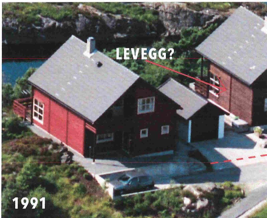
Foto fra 1991, der det ikke vises noen brannsmittende levegg mellom naboens bolig og garasje slik det pr. idag er. Det er mye nordavind i dette området, og dette vil gjøre fare for brannsmitting mot sør betydelig.

"Levegg" nr 2 som nylig ble satt opp mot vår tomt hersker det ingen tvil om; den er for lang til å stå der den står!