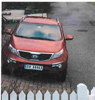
20. des 2017

Hva angår parkeringen, registrerer vi også at vår nabo etter å ha mottatt rekommandert sending fra oss vedr. dette, og om hvor tomtegrensen FAKTISK går, i to dager forsøker å presse sin bil lenger inntil, samt trekker inn ene speilet, for siden å gi blaffen igjen.