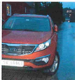
30. des 2017

Det er å tolke som at han har innsett fakta, men siden definerer sine egne regler for hva som er tillatt eller ikke. Slik kan vi ikke ha det.