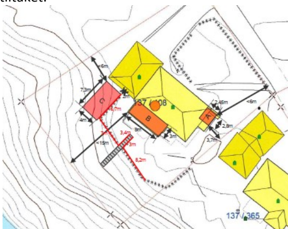
Revidert situasjonsplan mottatt 22.05.2014

Det er ein føresetnad for godkjenninga at tiltaka i sin heilskap ligg utanfor funksjonell strandsone. Tiltaka vert godkjent plassert slik det går fram av revidert situasjonsplan datert 04.05.2014 på vilkår av at den delen av trappa som ligg innanfor funksjonell strandsone vert fjerna. Alternativt kan det fremjast eigen søknad om dispensasjon frå byggjegrensa for funksjonell strandsone og søknad om løyve til tiltak for dette tiltaket.