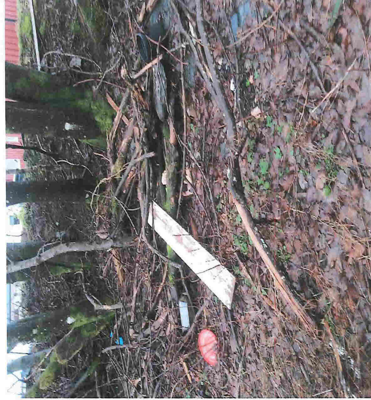
Dessverre er det også mye søppel inne på 107/9