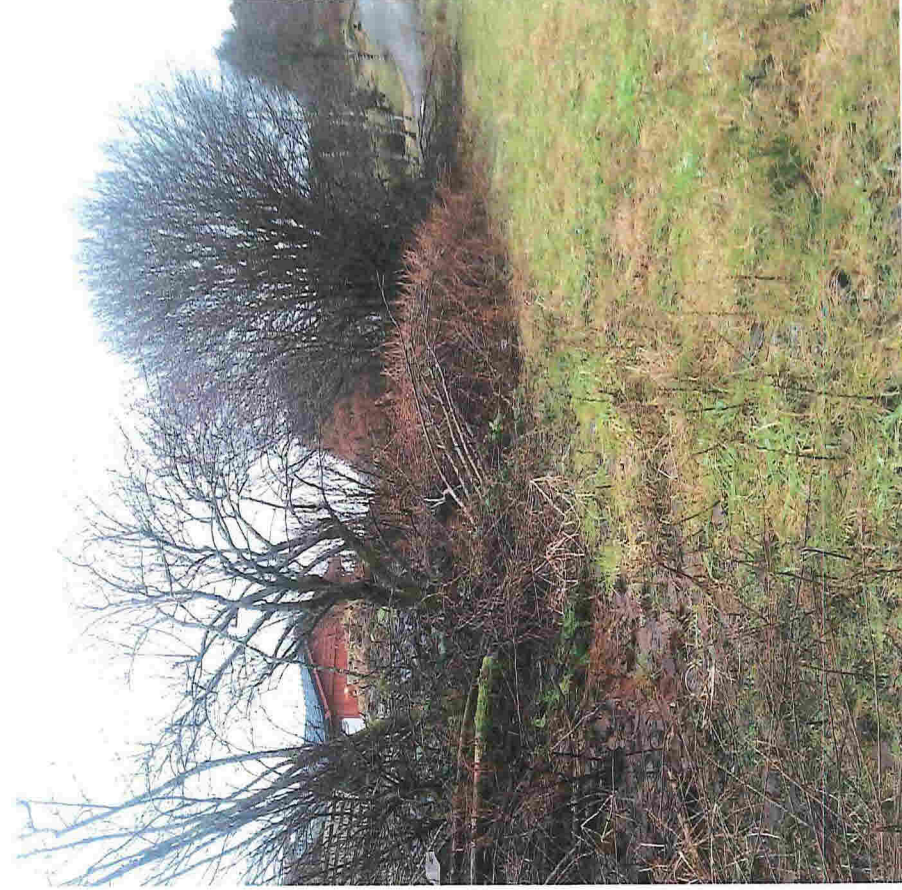
Langs/bak seljene er steingarden som tilhører 107/9 dekket av masser og ulike former for søppel.