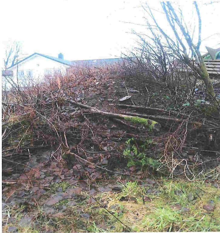
Haugen med masser dekker merke og steingard.