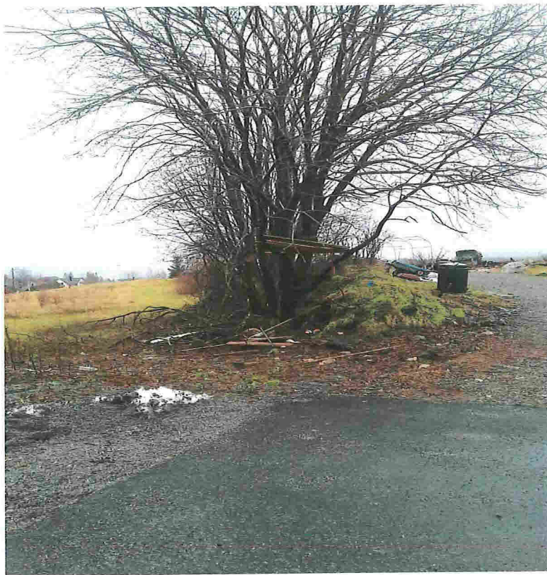
Ett sted på høyre side seljene, inntil seljene – under haugen – er steingarden. På dette bilde skulle også ditt nord-vestre grensemerke vise.