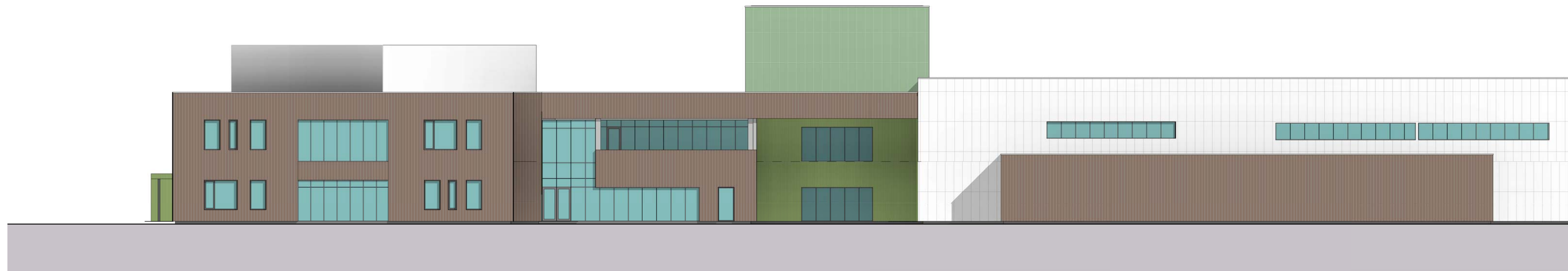
1 Vest 1 : 200