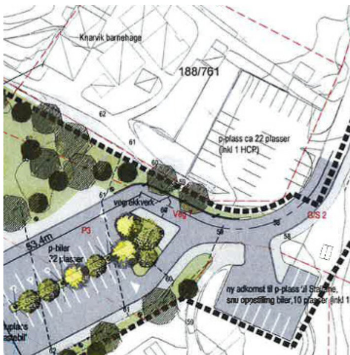
Utsnitt av situasjonsplan alternativ 1