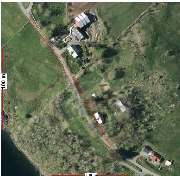
Illustrasjon siktlinjer 100m.

Eit absolutt krav vi stiller til nye avkøyrslø eller ved søknad om utvida bruk av eksisterande avkøyrslø er at det skal vere tilstrekkeleg sikt. Siktkravet i dette tilfellet vil vere at ein skal sjå 100 meter til kvar side av køyrebanen frå eit augепunkt 1,1 meter over bakken 4 meter inn i avkøyrsla. På synfaring målte vi at sikta ikkje er tilfredstillande. Sikta vart målt til rundt 60 meter i begge retningar. Dette er vesentleg under siktkravet som gjeld for ei fartsgrense 80 km/t.