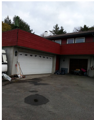
Bilete frå synfaring 16.10.2013

Lindås kommune har motteke melding om mogeleg ulovleg oppført garasje på eigedommen, samt bruk av garasjen til verkstadsverksemd. Kommunen var på synfaring på eigedommen 16.10.2013.