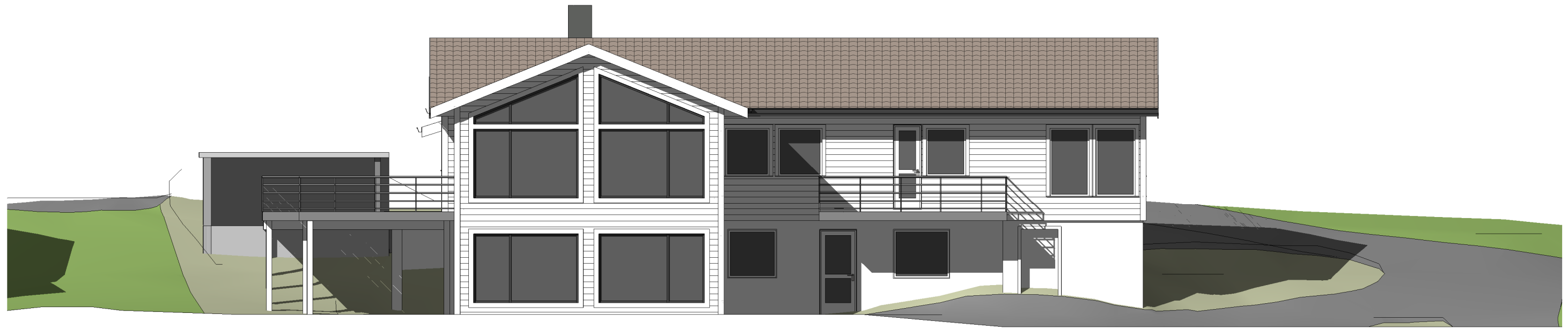
Nordøst 1 : 100