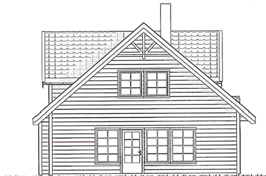
FASADE 2 Mot Nord/vest