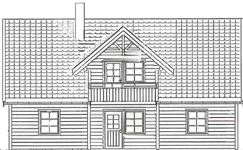
FASADE 1 Mot sør/vest.

NB! For boliger med netto varmeforbruk >15000kWh/år skal min.40% varmebehovet kunne dekkes av annen energiforsyning enn elektrisitet eller fossile brensler.