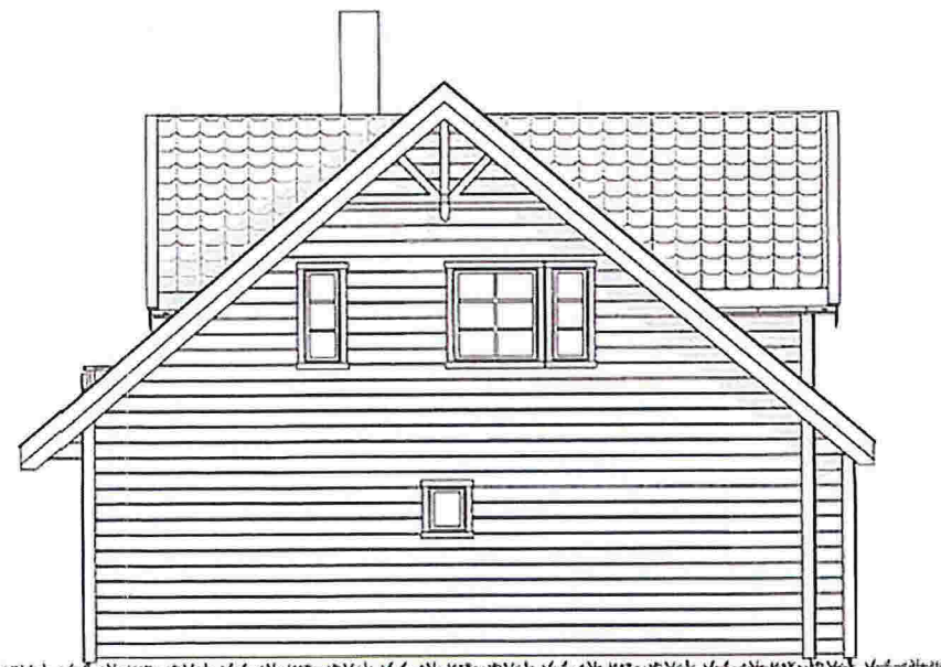
FASADE 4 Sør/øst