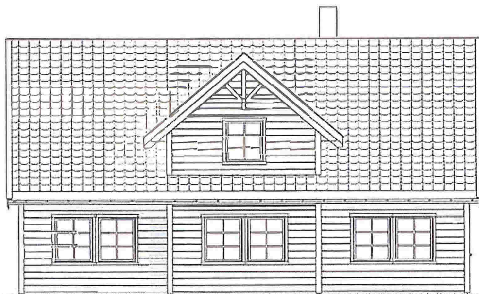
FASADE 3 Mot Nord/øst