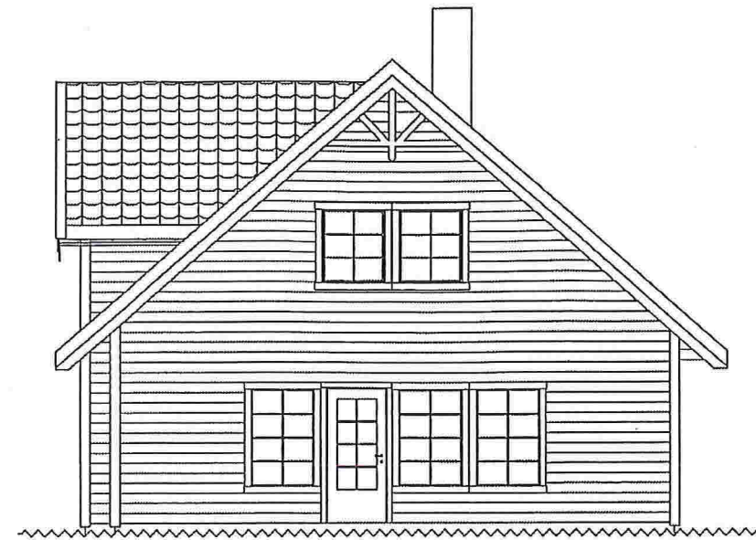
Fasade 2 Mot nord/vest