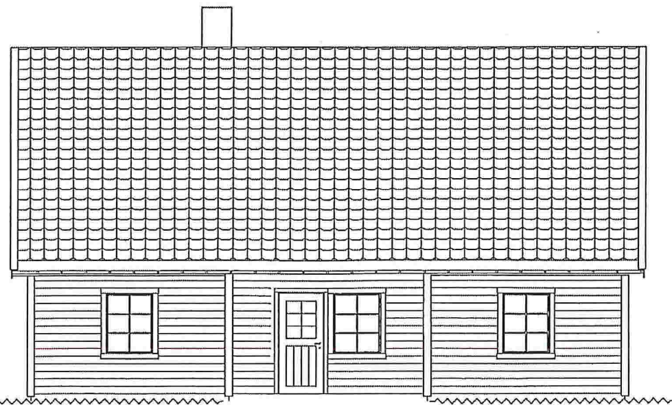
Fasade 1 Mot sør/vest