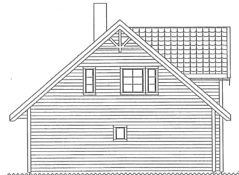
Fasade 4 Mot sør/øst