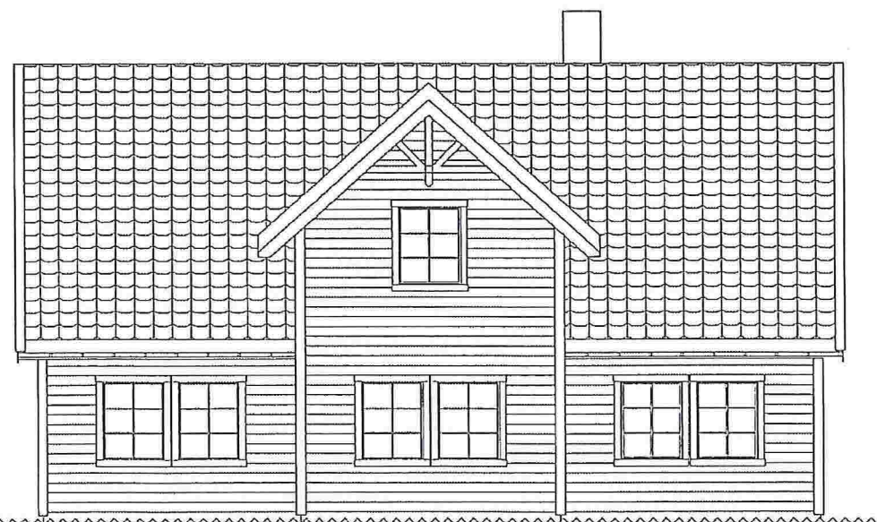
Fasade 3 Mot nord/øst