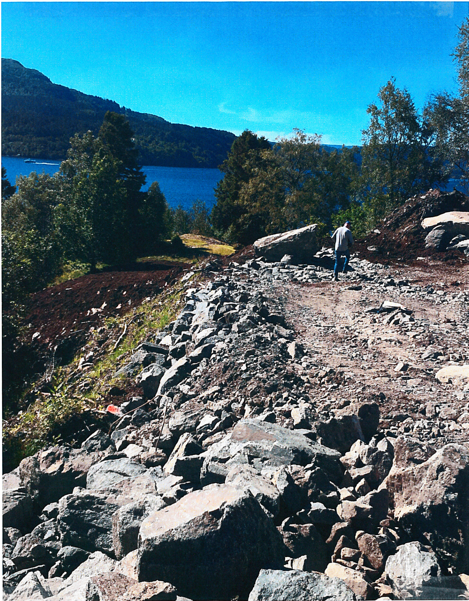
Bilde 2. 30.06.17. Sørøstre, midterste del av tomt. Her skal fjernes noe storstein og påfylles jord.