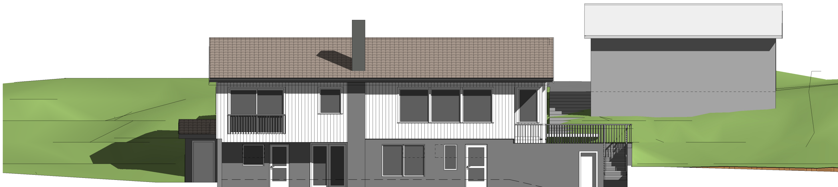
Vest 1 : 100