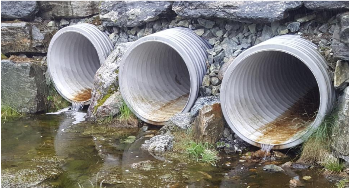
Figur 3: Kulverten under Lonsvegen ligger for høyt i terrenget på nedstrøms side, noe som byr på utfordringer for oppvandrende fisk på små og middels store vannføringer.