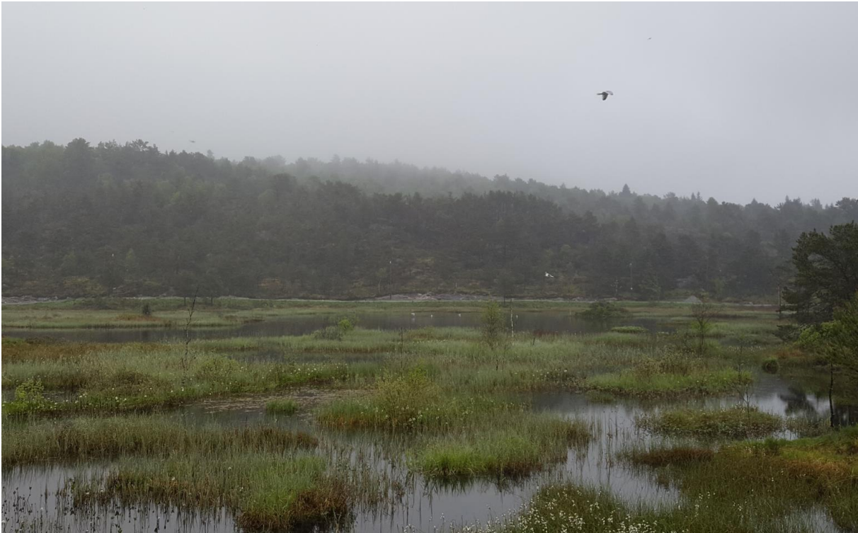
Figur 2: Lona er en grunn vannforekomst der store deler er dekket av flaskestarr, duskull og bukkeblad, arter som tyder på at vannet er oligotroft til mesotroft, det vil si relativt næringsfattig.

Fiskemåke (NT) og storkender ble observert hekkende i Lona. Ørret (0+ og ettåringer) ble observert i utløpsbekken og en mengde små vak ble sett i selve Lona. Flere mindre dammer i sørenden er adskilt fra resten av vannforekomsten, her ble det søkt etter amfibielarver uten resultat.