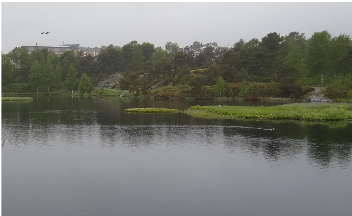
Figur 4: Flere par med fiskemåker hekker på øyene i Kvassnesstemma.