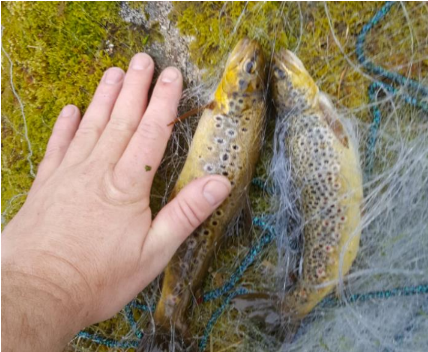
Figur 6: Småørret fra Kvassnesstemma.