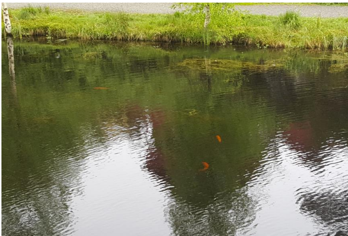
Figur 5: Store gullvederbuk (prydversjon av vederbuk) er lett synlige i dammen.