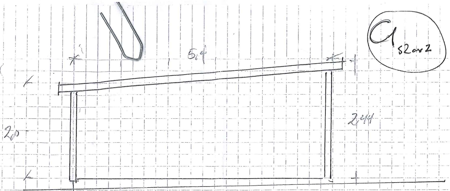
FASADE MOT NOED