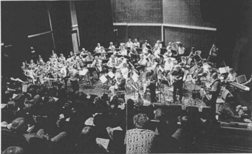
MUKTIG. Med fullt symfoniorkester i ryggen, får 50-tallet sin populærmusikk strikket ut preg av å være denne epoken sin klassiske musikk. Og kanskje det er det, som hundre år?

I «Synchro» fikk publikum høyre hørt. Det var i tillegg blues som vndertrykta teksten, med å lese og lage snot, med en hel så som