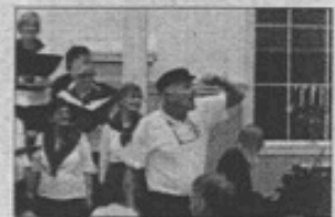
SYNG: Bygdaklang deltek på festen, og skal syngja for publikum.