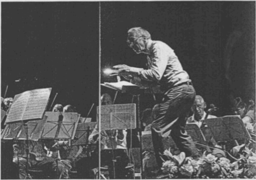
INN I DET UTEKENDTE: Å driva eit regionalt symfoniorkester utan å ha spørsmålsløse økonomiske samfunn er ikkje enkelt. Styret i Orkesteret Fossegrimen har ein stor del av saka for at orkesteret i dag held eit høgt framdriving med, men no kan Fossegrimen verta tvungne til å søle med aktivitet- og arbeidsutvald.

teir me var i kontakt med fylkespolitikarar all dagen etter at administrasjonen ein framlegg var gjort. Det høytar, me har berre ein råd på me for budjetet skal vedtakast. Det er no me har sjølvstøtt til å gjølla omstøtt det, seier Ringdal og legg til at budjettilskottane er positive og at orkesteret fikk å utvald-