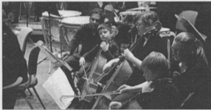
REDDAR SESONGEN: Fylkespolitikarane svikta Fossegrimen, men kulturpolitikarane på Voss trylla fram ekstramidlar frå budsjettet. Her ser me orkesteret i øving med ei gruppe elevar frå kulturskulen.

- Ein merkeleg påstand. Fossegrimen hadde konsert på Osterøy så seint som i fjor, medan orkesteret sitt prosjektkor har vore både i Bergen og på Dale siste året. Og innan orkesteret sine rekkjer har me medlemmer frå ei rekke av grannekommunane, inkludert Ulensvang,