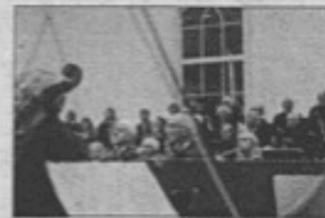
OPNAR: Fossegrimen opnar jubileumsframsyninga, og skal spela med både spelemannslaget og distriktsmusikarane.

For dei litt eldre går filmar som Daddy's Home, En mann ved navn Ove, Creed - The Legacy of Rocky og sjølvst Star Wars: The Force Awakens. For dei som