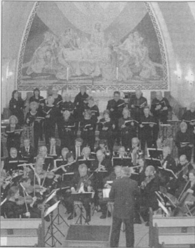
► OKESTER: Fossegrimen med kor i kyrkja på Dale.