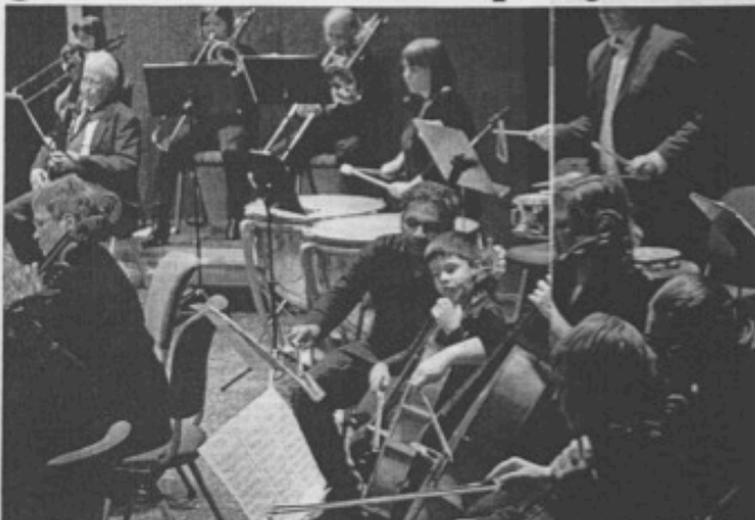
FOR FULL MUSIKK: Orkesteret Fossegrimen får innval starta på fylkeskommunen, og sikrer drifta framover. Her 65 konsert i Voss kulturhus i mars.

- Det har vore ein god prosess politisk, men Fossegrimen skal og ha ros for den jobben det har