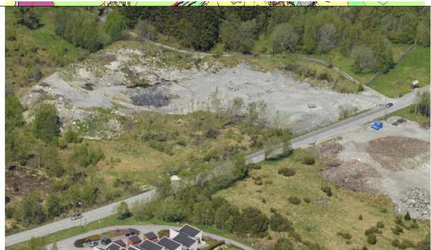
Skråfoto frå 2012