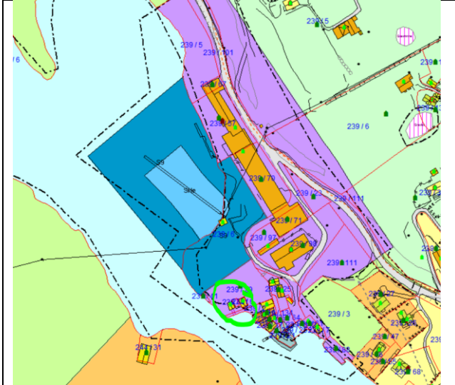
Kommuneplan med omriss av reguleringsplan