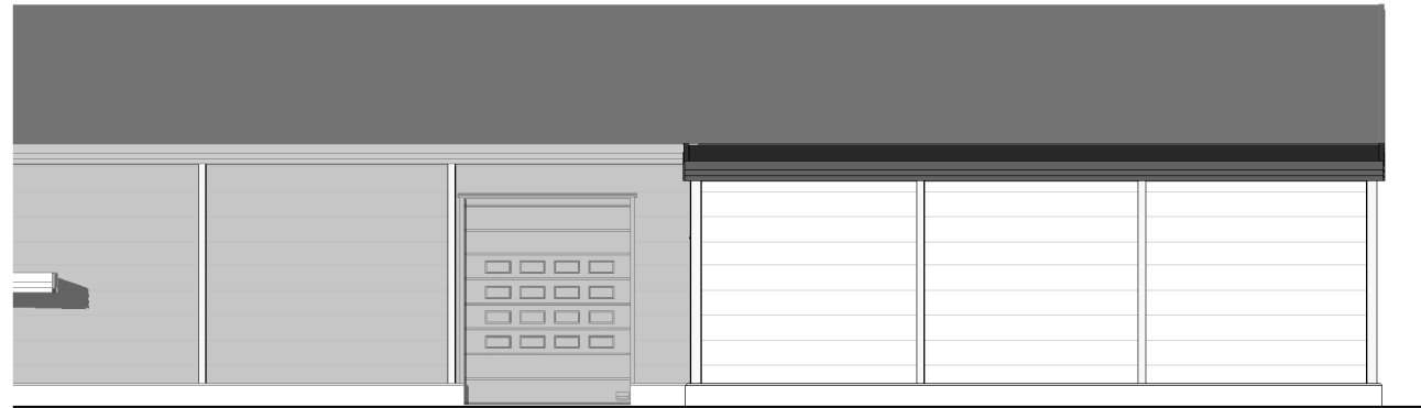
1 Sør-øst 1 : 200