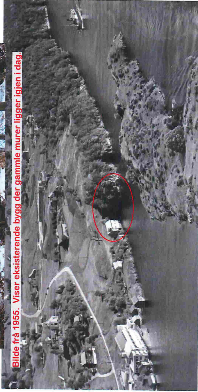
Bilde frå 1955. Viser eksisterende bygg der gamle murer ligger igjen i dag.