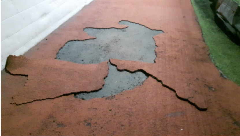
Løpedekke søndre kortsid