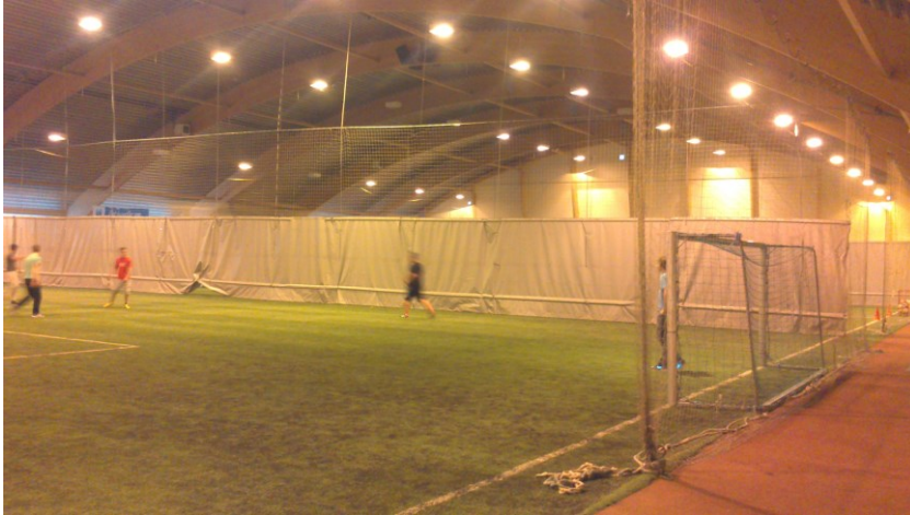
Lysanlegg, treningslys. Stadig behov for skifting av pærer.