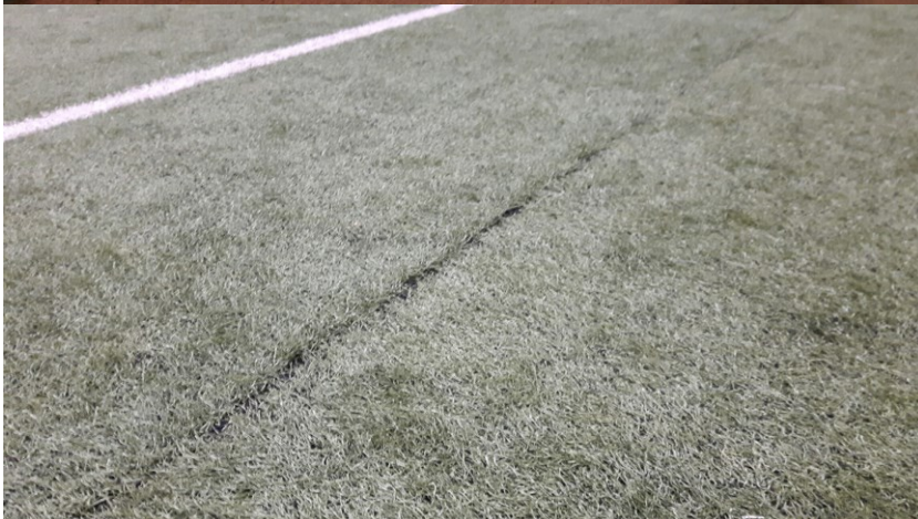
Skøter på grasmatte går opp i liminga