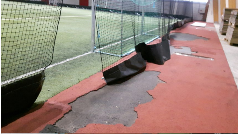
Løpedekke nordre kortside mot hoppegrop