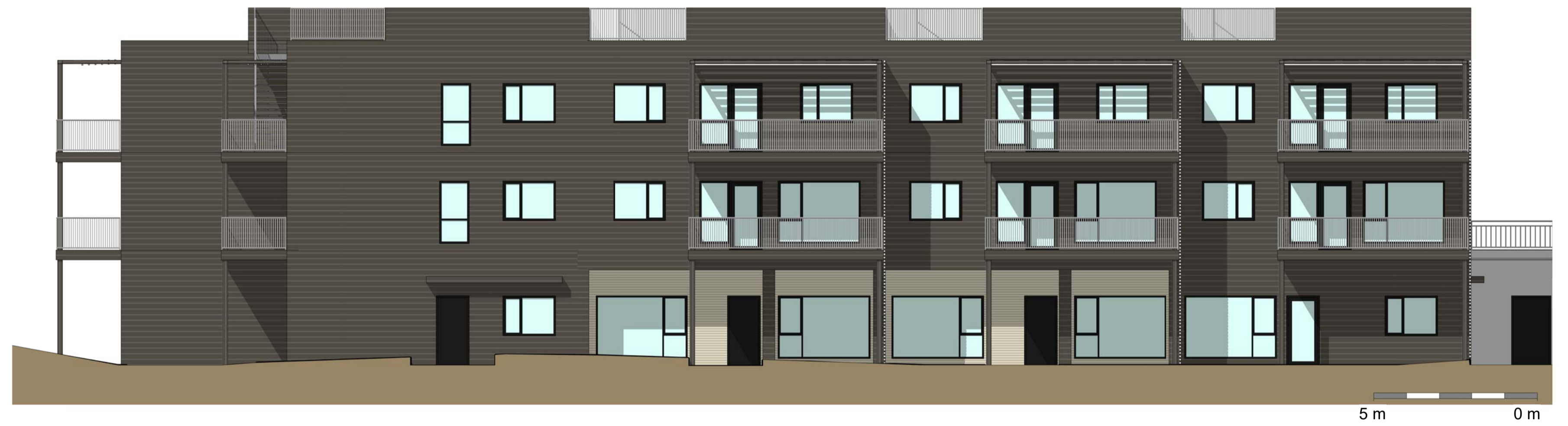
2 Bygg C - ØST 1 : 100