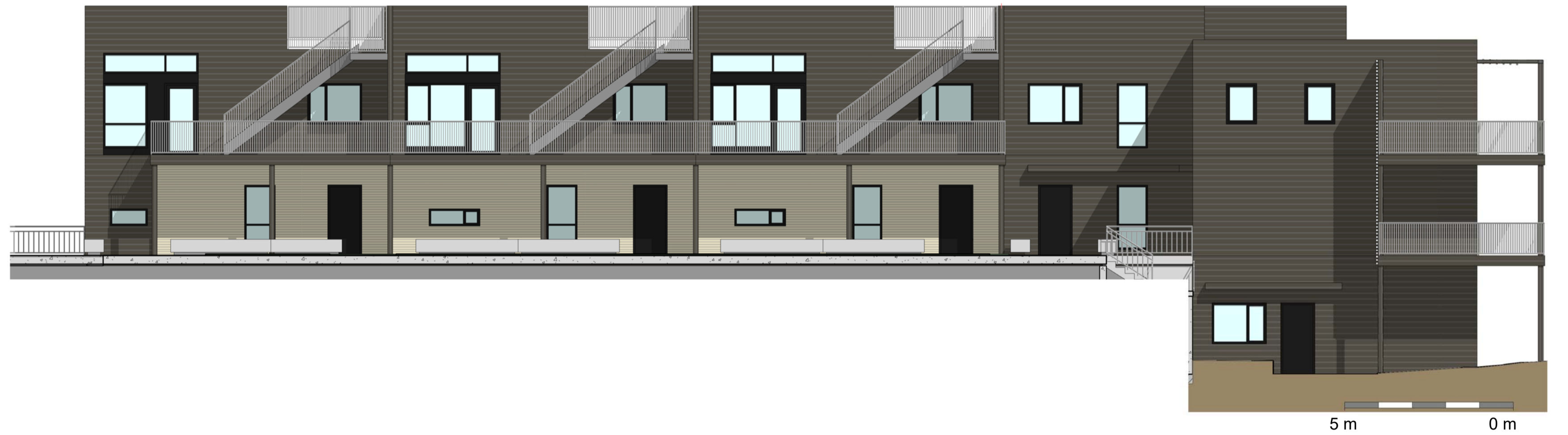
4 Bygg C - VEST 1 : 100