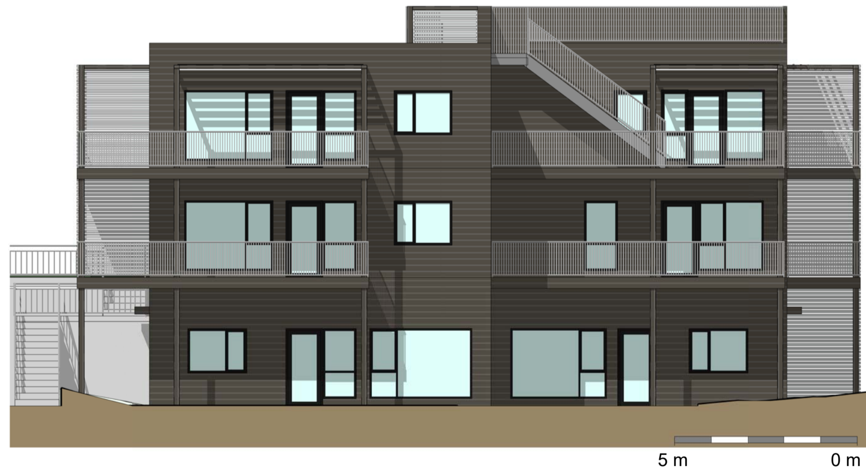
3 Bygg C - SØR 1 : 100