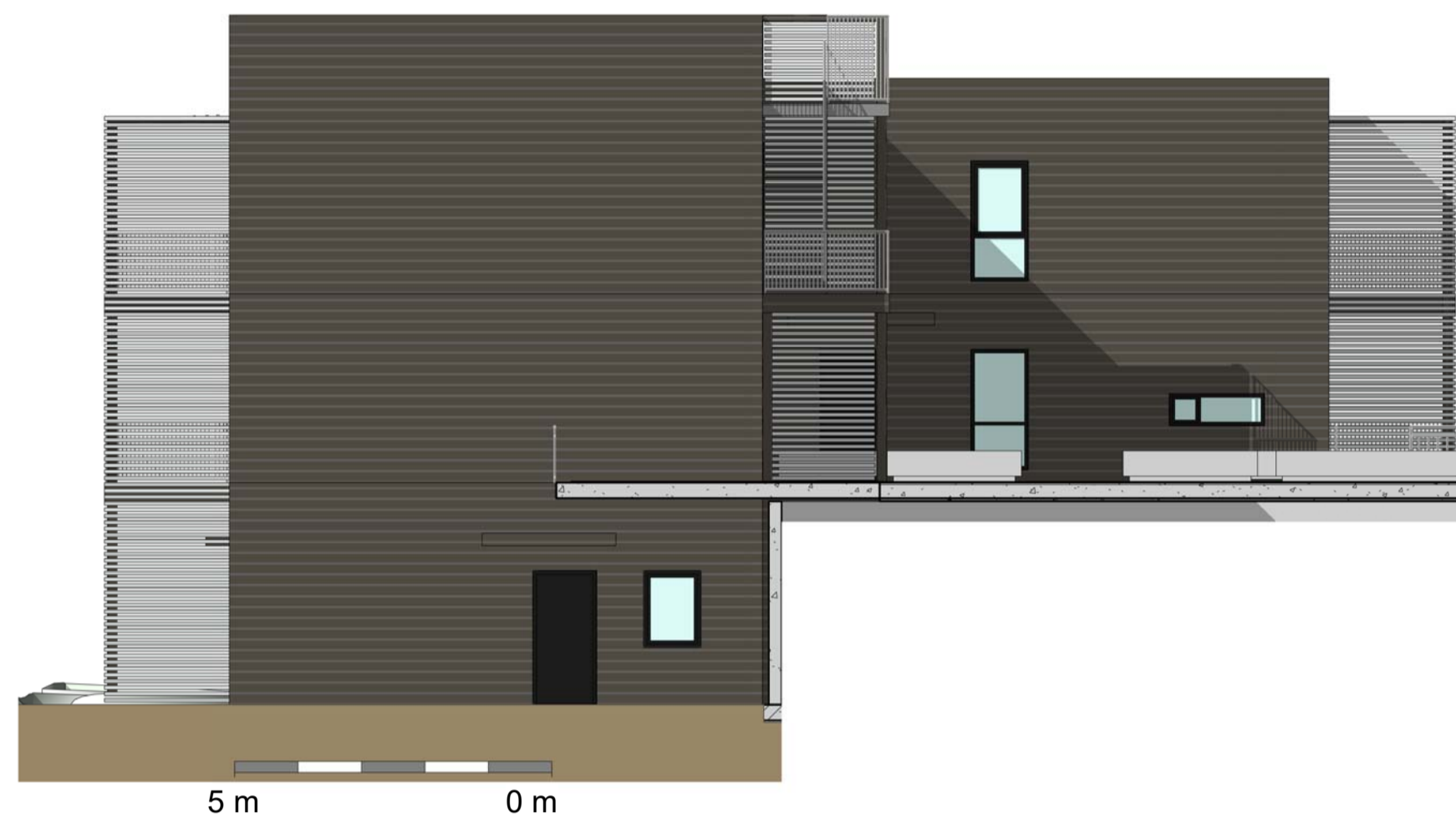
1 Bygg C - NORD 1 : 100