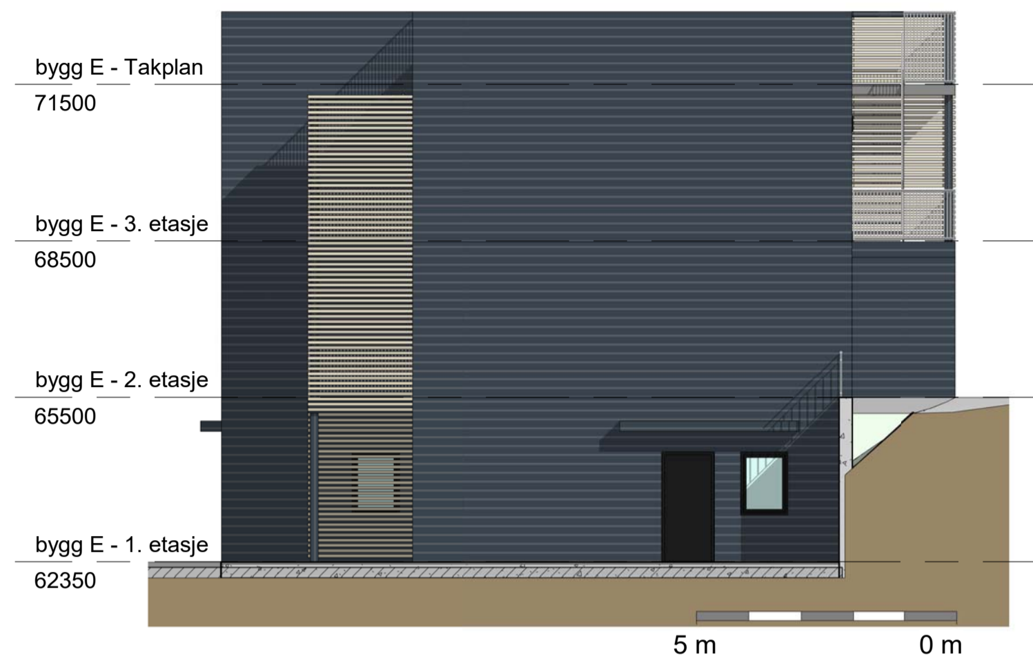
1 Bygg E - NORD 1 : 100