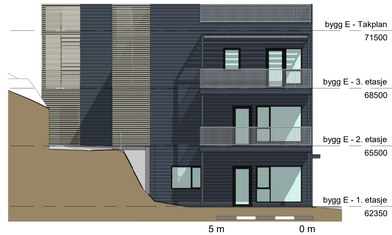
3 Bygg E - SØR 1 : 100