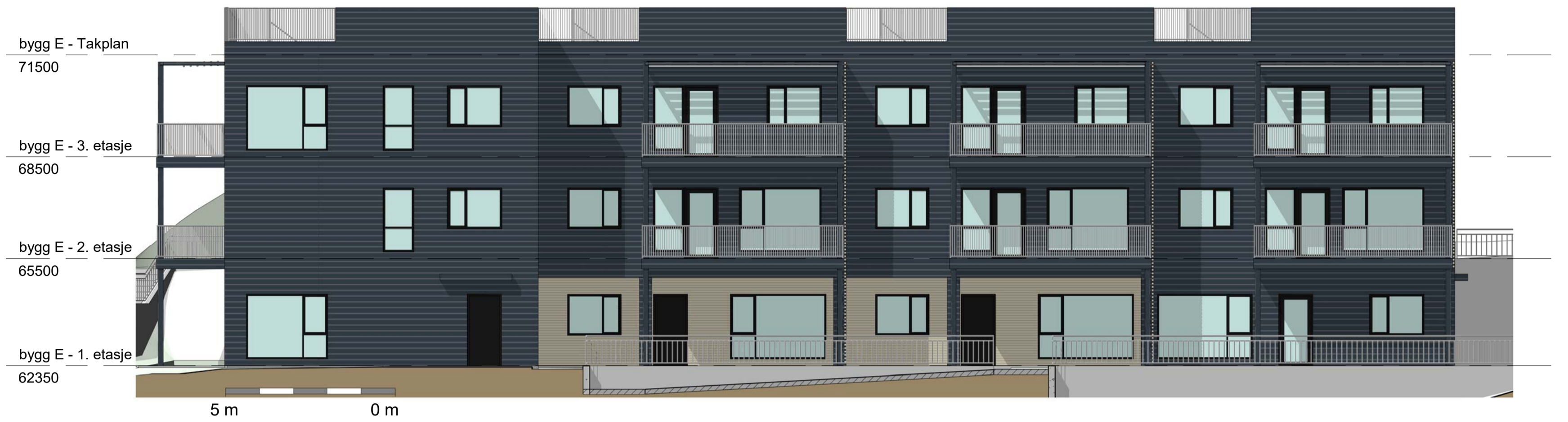
2 Bygg E - ØST 1 : 100