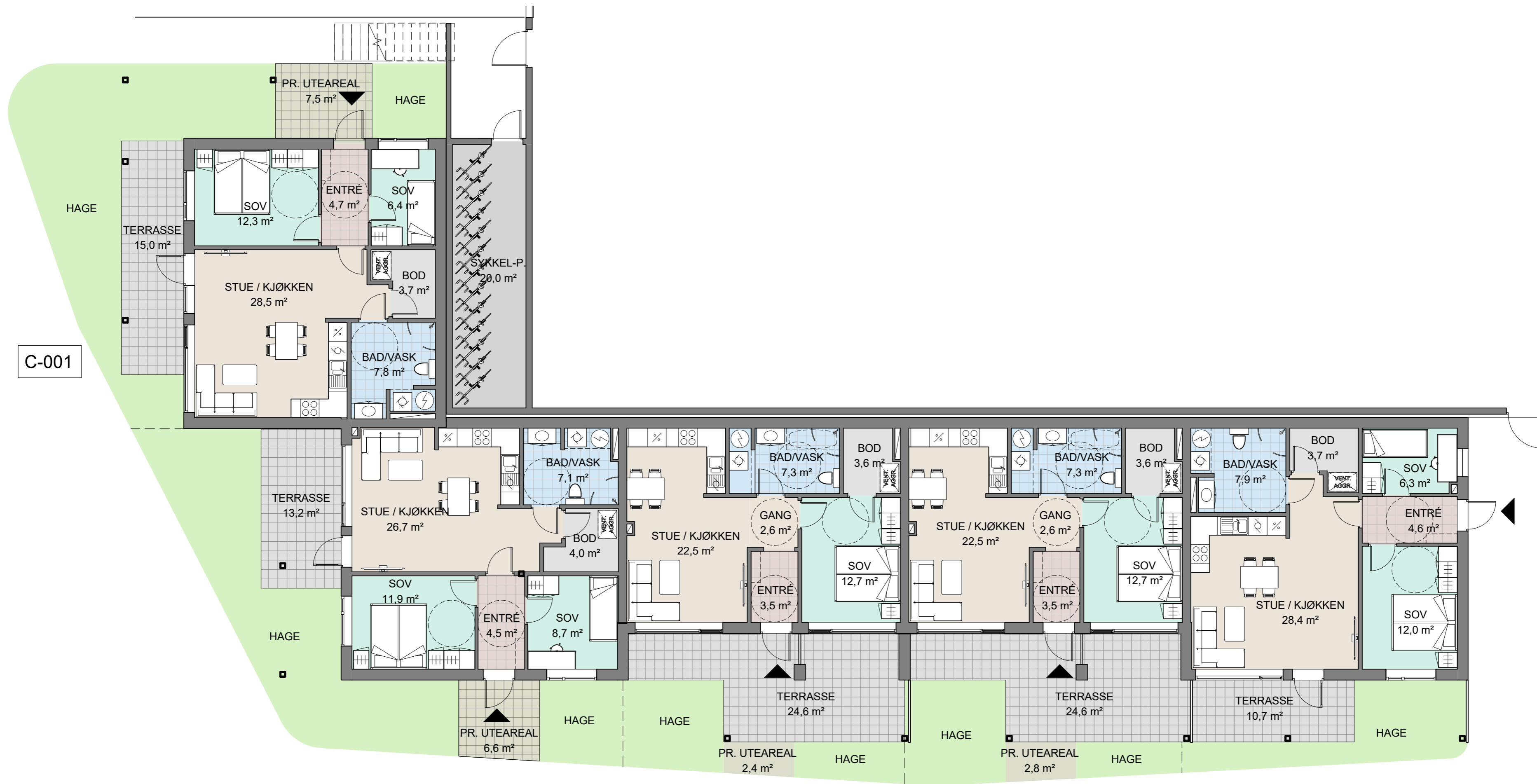
1 Salgstegning - C - U. etasje 1 : 100