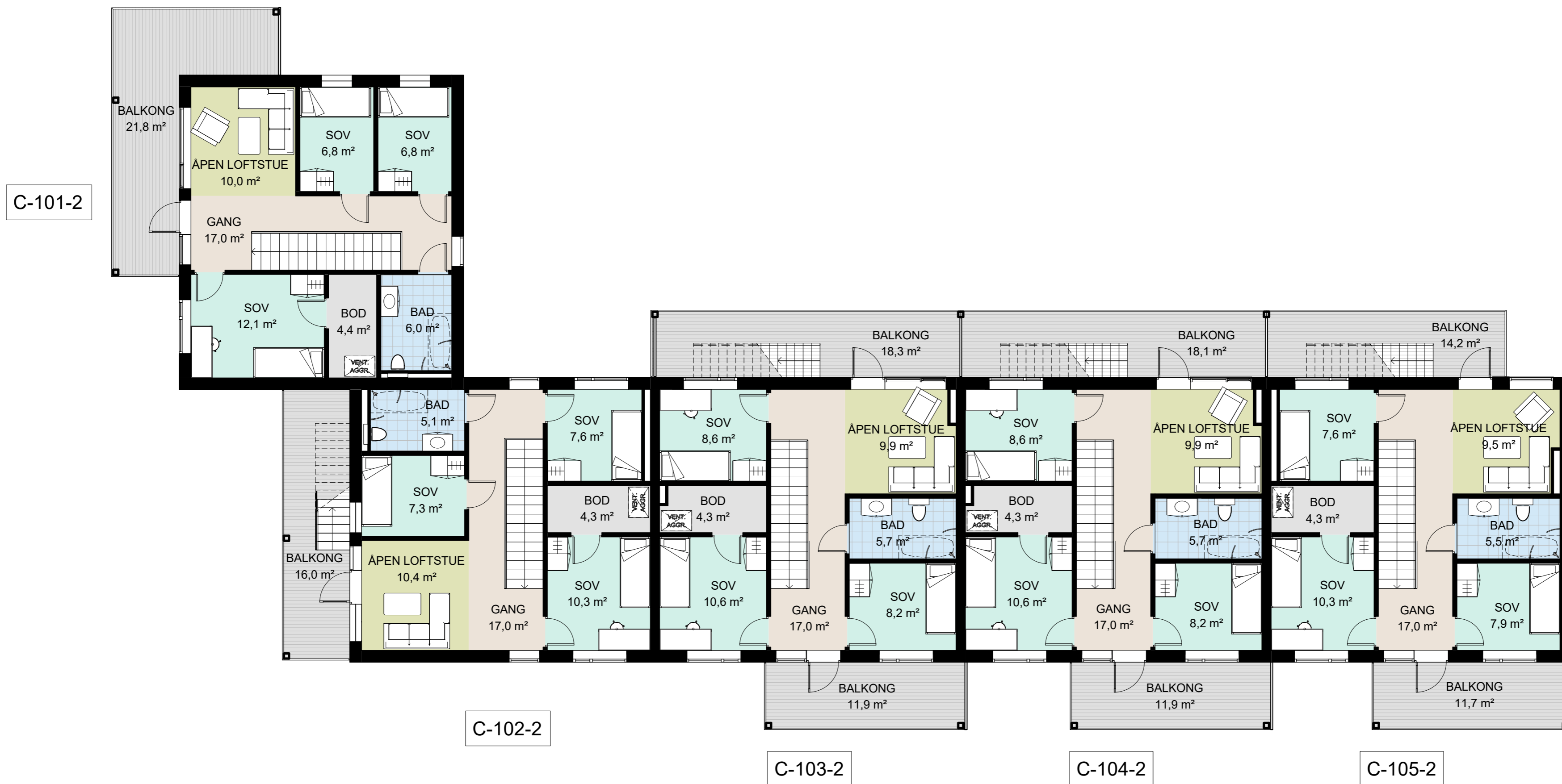
1 Salgstegning - C - 2. etasje 1 : 100