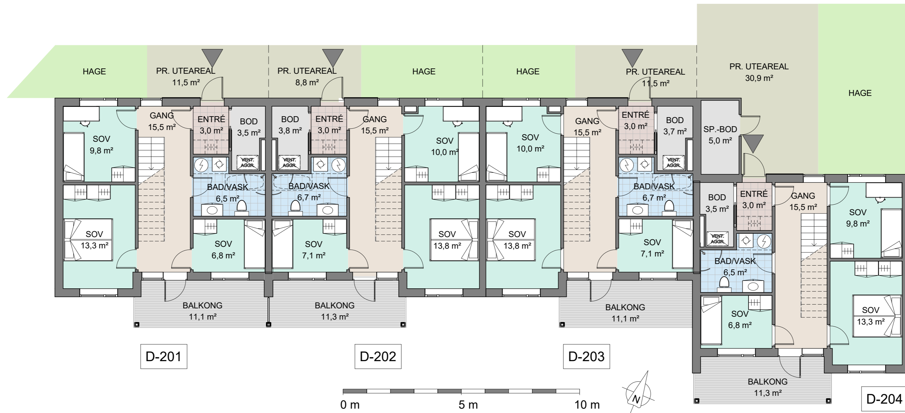
1 Salgstegning - D - 2. etasje 1 : 100