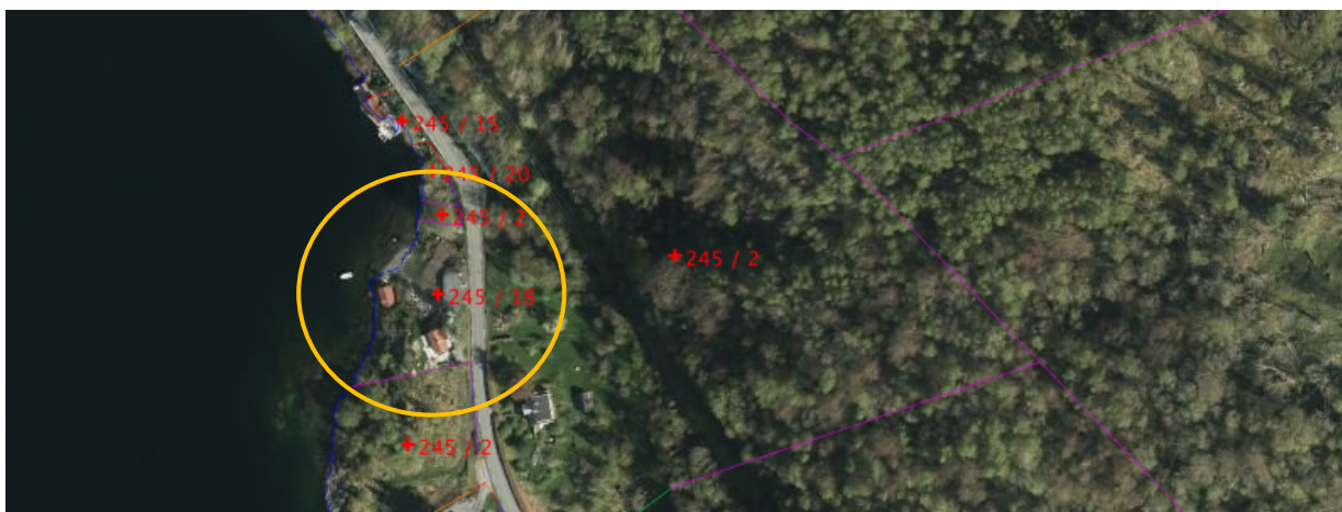
Flyfoto over gnr. 245 bnr. 18

Parallelt vil søkar også søke om dispensasjon frå byggeforbodet i § 1-8 og LNF-føremålet i kommuneplanen om eit nytt naust med båtopptrekk og plattung på same fritidseigedom. Slik vi har oppfatta saka, har kommunen vald å dele søknadsprosessen i to; ein søknad for tilbygget og ein søknad for nytt naust inkludert båtopptrekk og plattung.