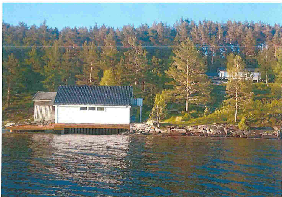
Bildet av naustet slik det kan sjå ut med kai rundt