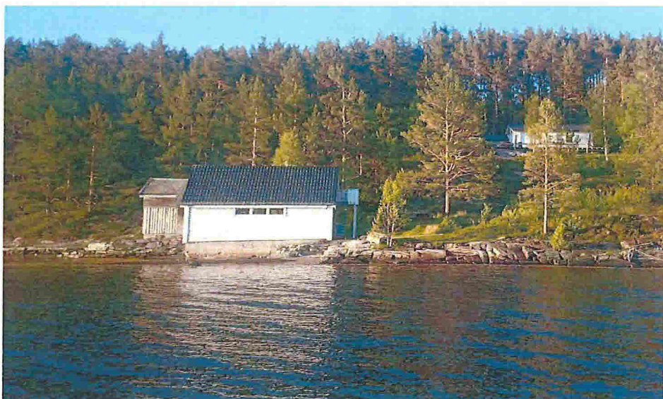
Bildet av naustet slik det ser ut i dag.