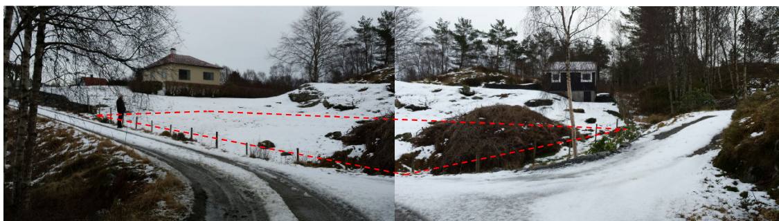
Foto fra vest, ny tomt er vist med rød strek