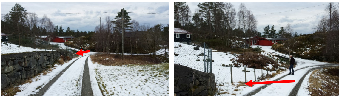
Foto fra øst, ny avkjørsel etableres ved rød pil