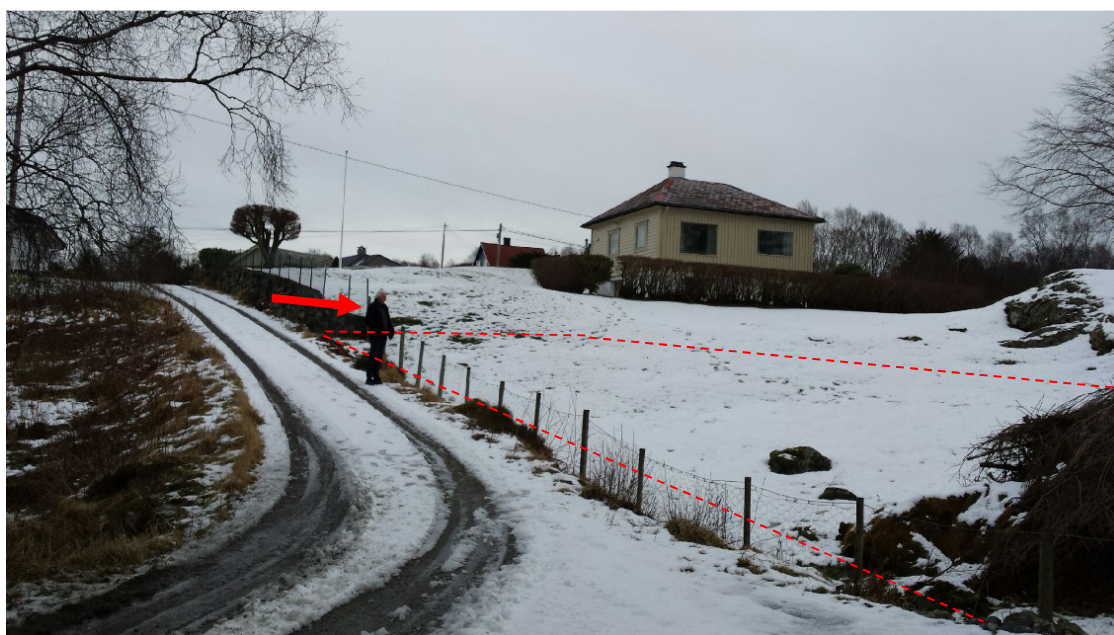
Foto fra vest, ny avkjørsel etableres ved rød pil