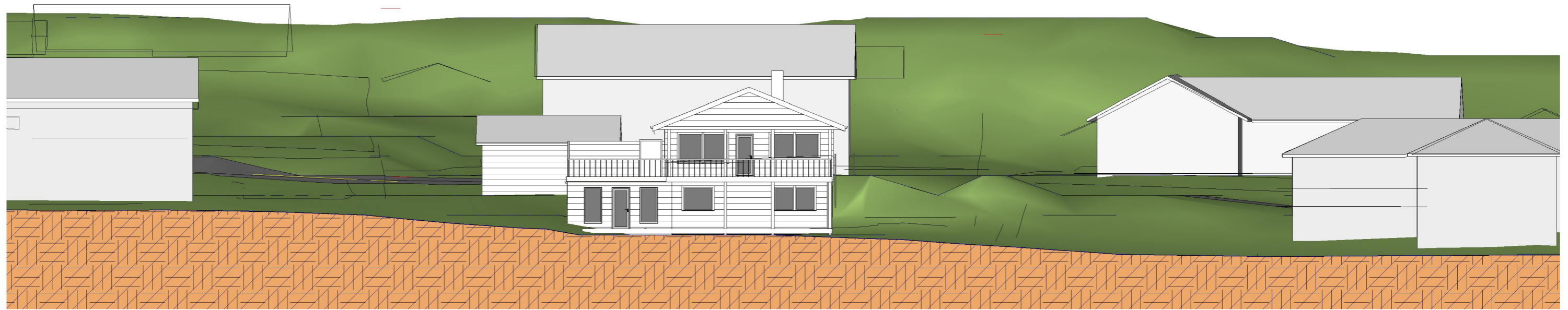
Terrengsnitt sørvest 1 : 200