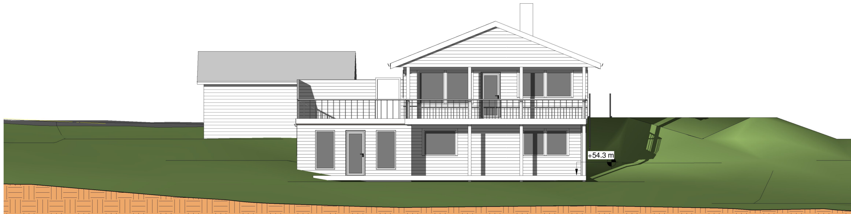
Sørvest 1 : 100