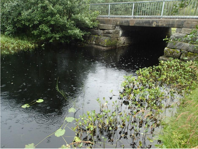
Figur 6. Kanal/ elv mellom Skodvinsvatnet og Gaulevatnet. Deler av kanalen er dekt av ein kulvert. Merka c i Figur 1.