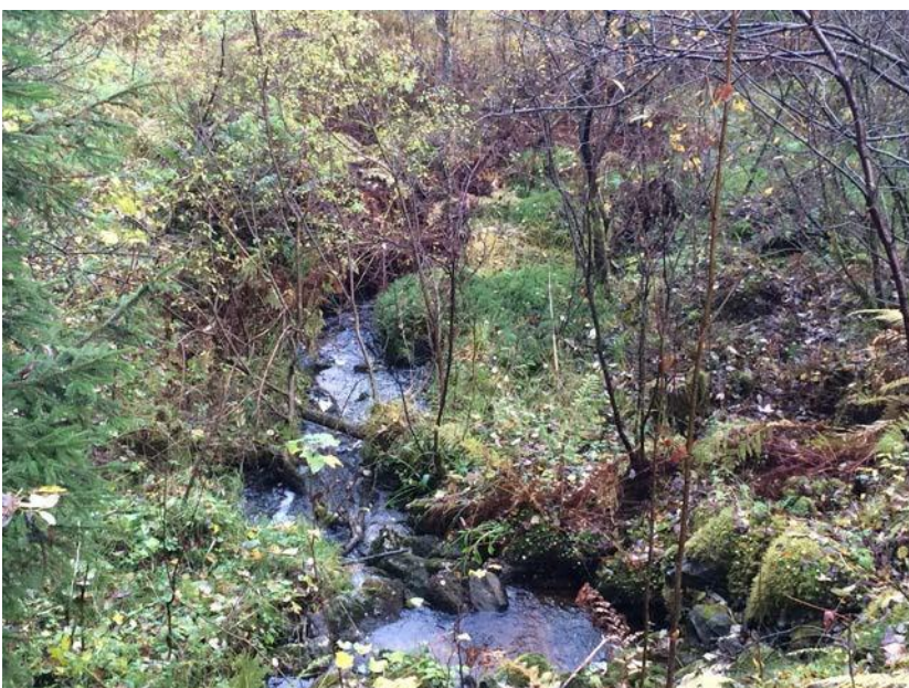
Figur 11. Ein tillopsbekk renn frå sør mot våtmarka mellom Våge og Vågseidet. Merka g i Figur 1.