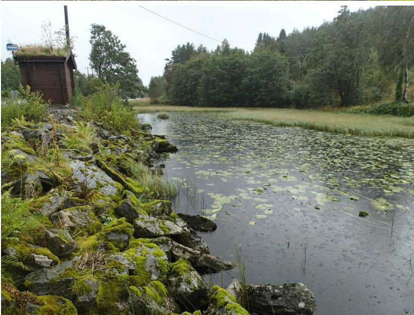
Figur 5. Nordvestre hjørne av Skodvinsvatnet. Vegen går omlag 380 langs vasskanten. Merka b i Figur 1.