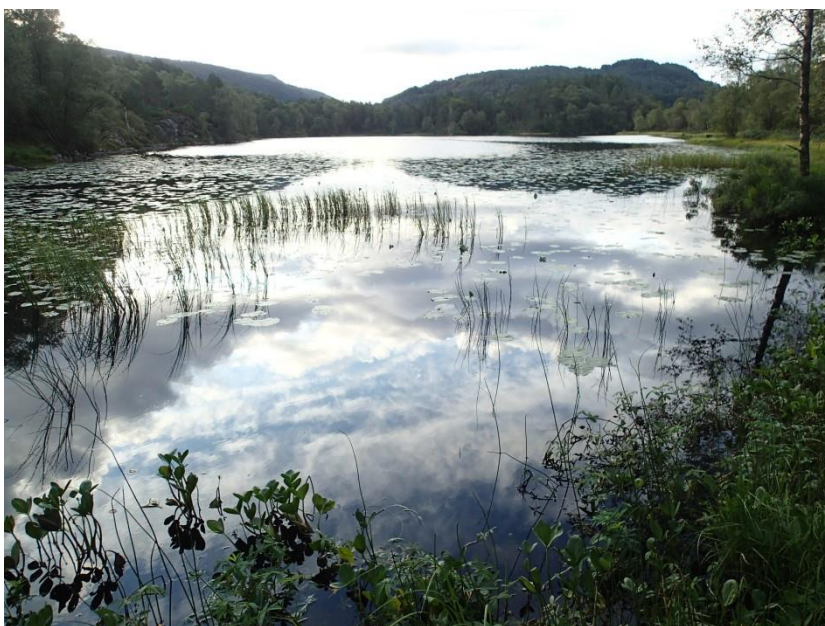
Figur 2. Skodvinstjørnet sett frå nordleg bredde og mot sør.