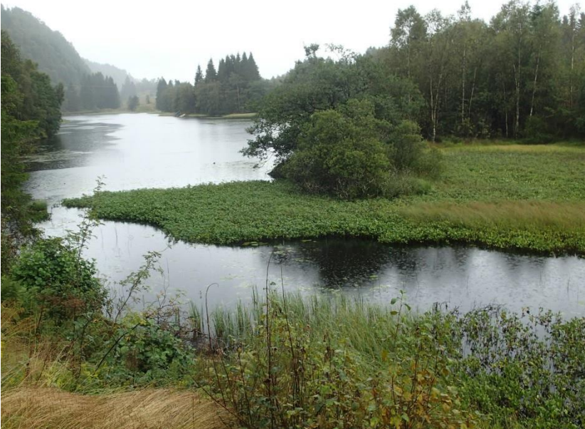
Figur 7. Kanalen frå Skodvinsvatnet renn ut i Gaulevatnet. Langs vasskanten er det våtmark med tett vegetasjon som for det meste består av bukkeblad. Merka c i Figur 1.