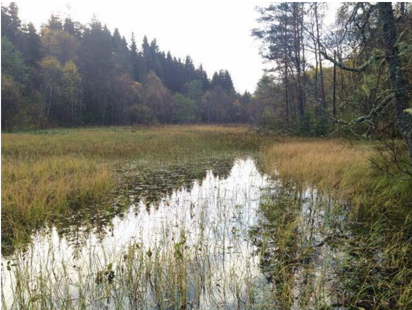
Figur 10. Mellom Våge og Vågseidet ligg ein våtmark, her fotografert mot nord. Fv.57 ligg omlag 15 meter frå våtmarka (mot venstre for biletet). Ein vegfylling ligg mot sør. Merka f i Figur 1.