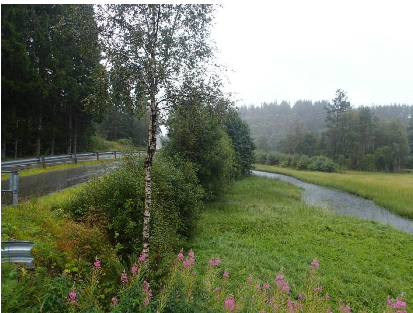
Figur 8. Frå Gaulevatnet renn Gauleelva mot Fjellangsvågen. Elva er omlag 2,1 km lang, der dei første 700-800 m renn langs fv.57, vest for vegen. Denne strekninga er for det meste sakteflytande og med våtmark langs land. Merka d i Figur 1.