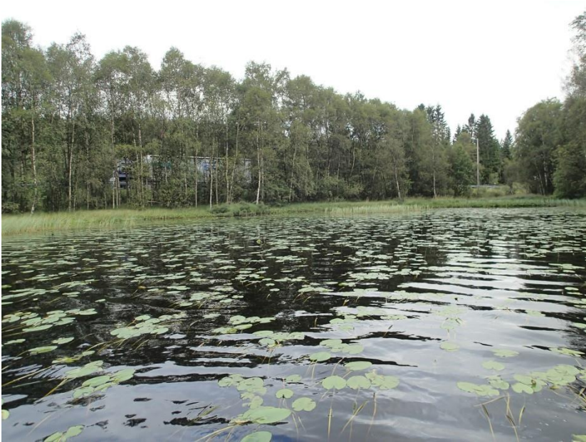
Figur 3. Skodvinstjøret sett mot nordleg bredde i retning fv.57. Legg merke til at vatnet er noko skjerma mot passerande trafikk. Merka a i Figur 1.