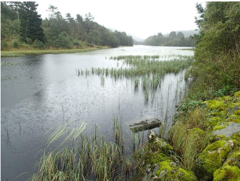
Figur 4. Skodvinsvatnet sett mot søraust. Steinfyllinga frå fv. 57 går delvis ut i vatnet. Merka b i Figur 1.