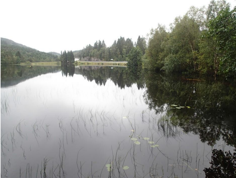
Figur 9. Eidsvatnet ligg rett aust for fv.57. Vatnet er ikkje skjerma for vegen. I forgrunnen veks det kvit nøkkerose og kjerringrokk. Storlom hekkar i vatnet. Merka e i Figur 1.