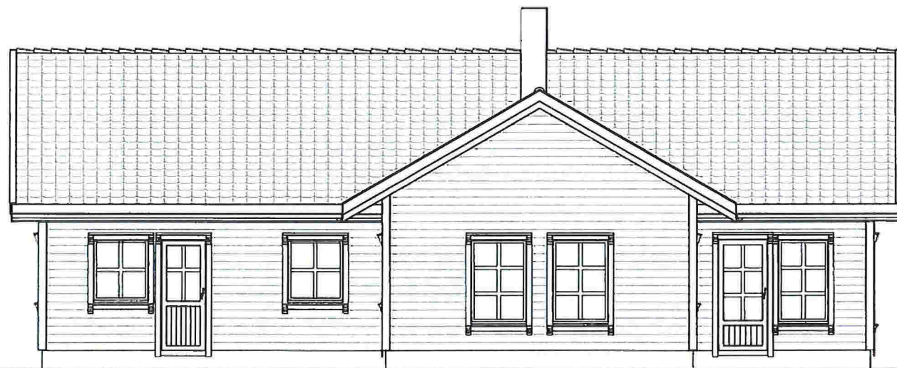
Fasade Mot Vest 1 : 100