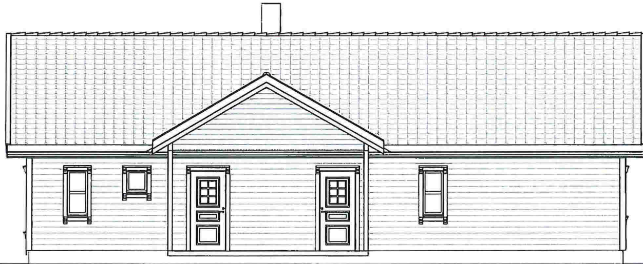
Fasade mot Aust 1 : 100