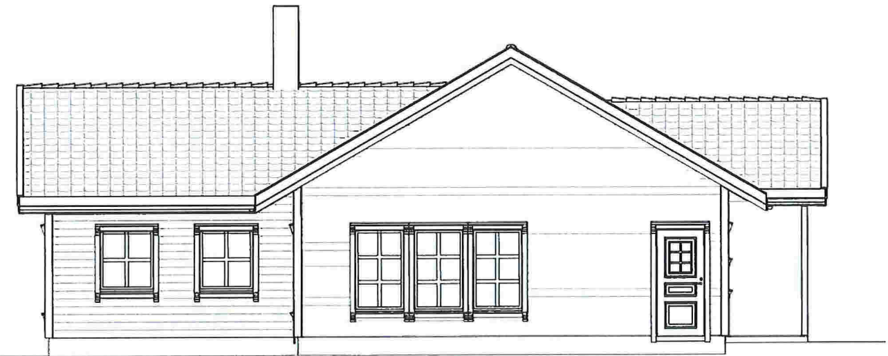
Fasade mot Sør 1 : 100