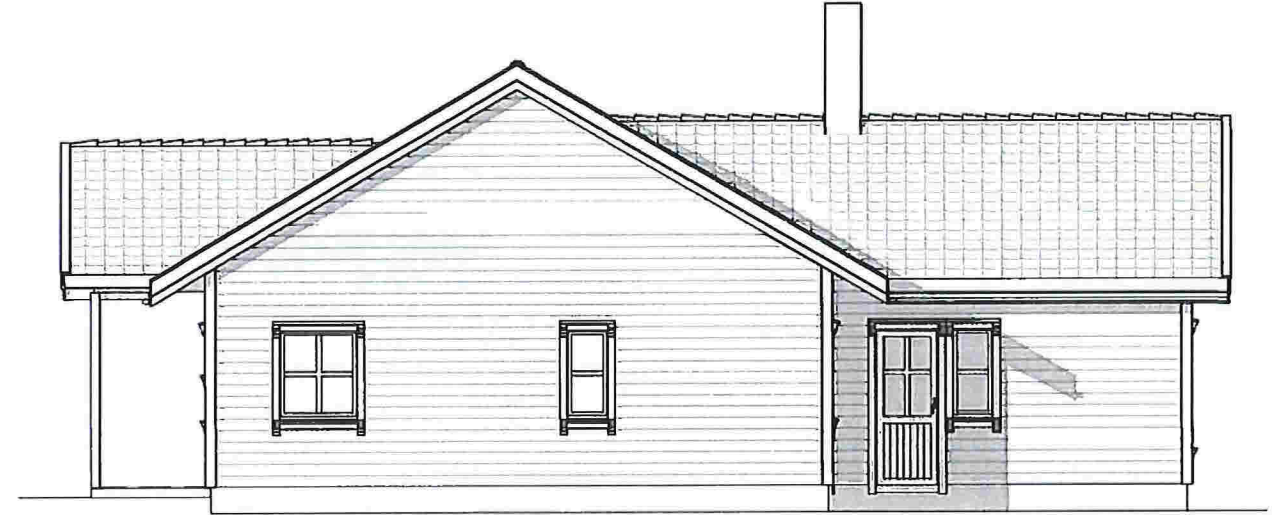
Fasade mot Nord 1 : 100