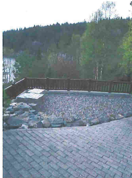
Alt. 2 Begrenset innsyn fra sjøen mot biloppstillingsplass.

Plasseringen gir begrenset skråningsutslag mot stigende terreng i øst, og tilsvarende lav støttemur på nedsiden av biloppstillingsplassen mot vest. Løsningen vurderes derfor som både hensiktsmessig i forhold til bruk og godt løst med tanke på naturgitte omgivelser til tilstøtende areal.