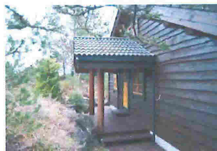
Tiltaket er gjennomført i tråd med hyttens generelle stilmessige uttrykk og byggemåte

Tiltaket er oppført på fasade som vender bort fra sjøen, og er plassert på del av eiendommen hvor det er til begrenset visuell sjanse for naboeiendommer. Takets møne ligger lavere enn møne på hyttetaket, og form/uttrykk er med på å gi hytten en passende skala og avslutning mot øst når man vurderer helhetsinntrykket av fritidsboligen sett fra øst, nord og sør. Terranget øst for hytten fremstår som naturtomt, og viser en god tilpasning mellom tiltak og eksisterende terreng.