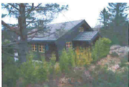
Terreng/høydedrag øst for hytten (mot gnr.113/bnr.7)

Tiltaket som er etablert på hyttens østfasade, og er utført med saltaksform som en åpen konstruksjon med søyler i front. Takvinkel og møneretning sammenfaller med hyttetaket.