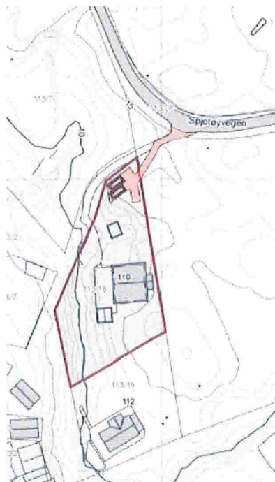
Alt. 1 tilkomstvei/biloppstillingsplass

Biloppstillingsplass ved alt. 2 er allerede etablert på eiendommen og forutsetter bruk sjøveien fra den kommunale veien og fram til biloppstillingsplassen.