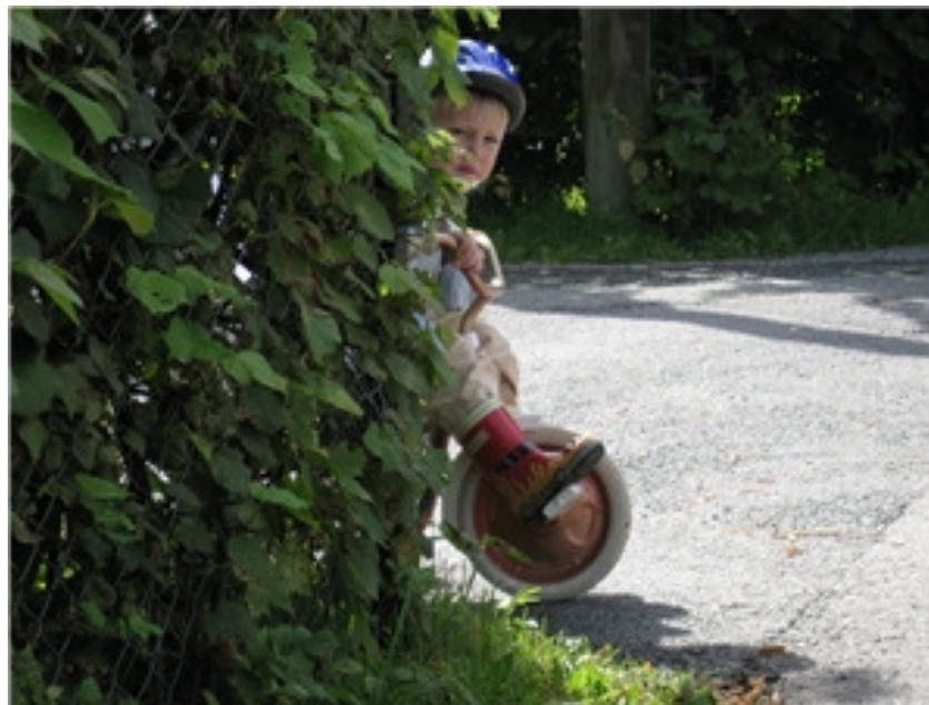
Gut på trehjuls sykkel – delvis skjult av hekk